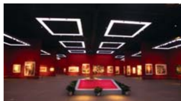
美术馆一号厅，可以根据作品需要调节射灯高度。