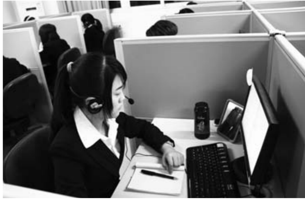
寿光蔬菜调度呼叫中心工作人员正在接听蔬菜配送订单。

作为蔬菜之乡，寿光在发展蔬菜种植、加工的同时，不断创新销售模式。现在，从不足1克的小小种子到价值百万元的蔬菜大订单，都可以借助电子商务平台走向全国各地。