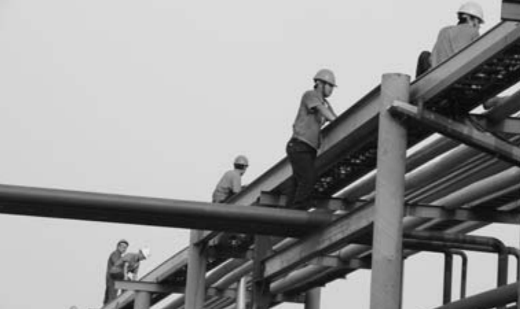
东方宏业新建厂房紧张施工。

对联：有志者、事竟成，破釜沉舟，百二秦关终属楚；苦心人、天不负，卧薪尝胆，三千越甲可吞吴。