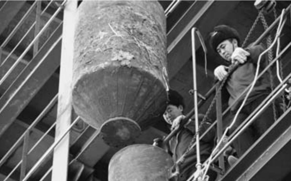
东方宏业设备安装现场。