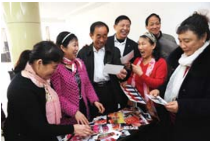
“辣妈”们与朋友分享她们演出的照片，她们现在一年有上百场演出，平均每周两场。