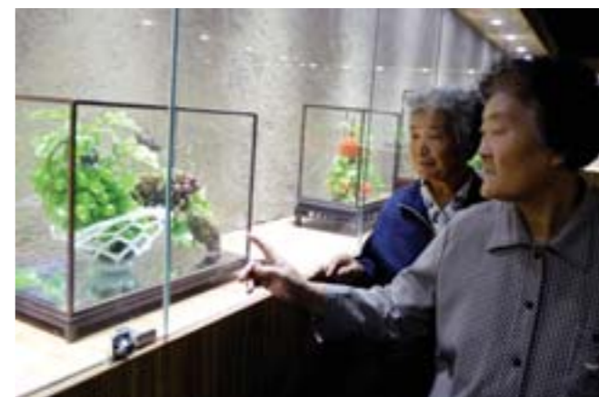
▲平常难得一见的琉璃精品在琉璃节期间与爱好者见面。