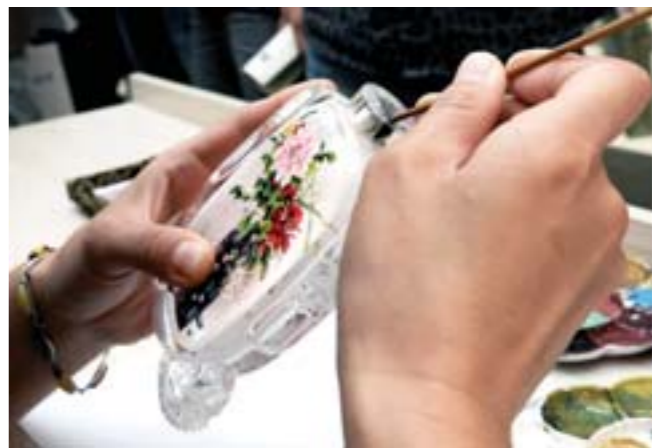
▲博山琉璃内画以画作丰富细腻见长，细微之处需用四一五倍以上的放大镜观看。