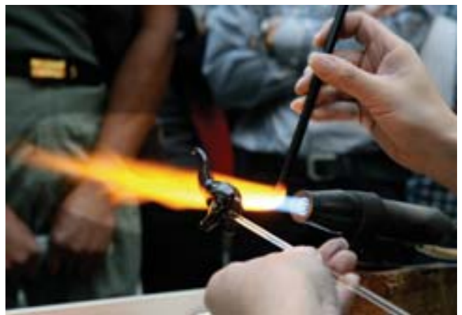
▲在1000多度高温下，一块毫无生机的琉璃料在工艺师的手中变成一件件精致的工艺品。