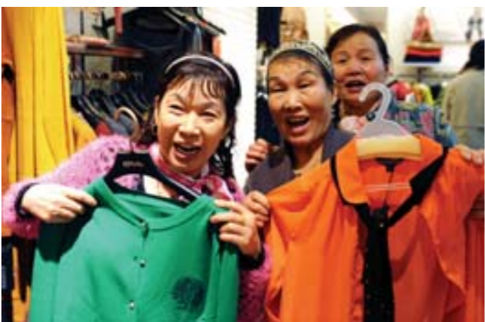
“辣妈”们到品牌服装店试衣服，她们演出的服装都是自己设计、专门订制的。