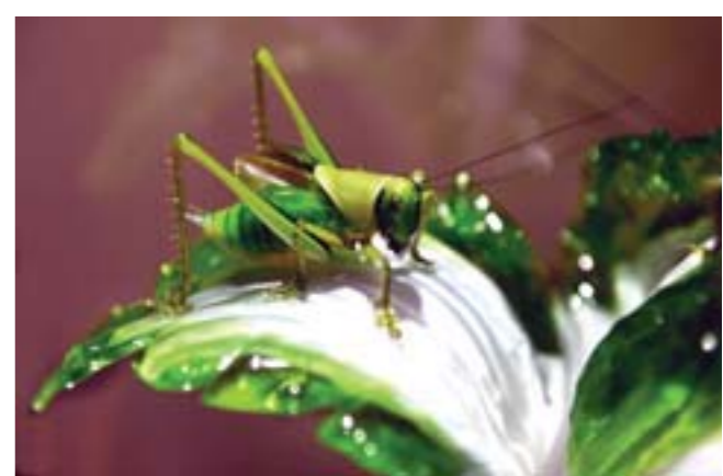
▲一件精美的琉璃作品上的小动物栩栩如生，几乎可以乱真。