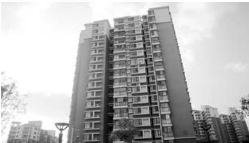
□于冬亮 报道 莱山区一新小区外景。从壁挂的空调可以看出小区入住率并不高。

冬季即将到来，烟台市也将进入供暖季。据了解，烟台今年冬季的采暖期为2013年11月16日至2014年3月31日，共计136天。但随着取暖费的开征，烟台新城不少市民又遇到了“供暖”烦恼。