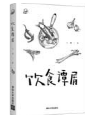
《饮食谭屑》 兰楚 著 清华大学出版社

他被誉为“中国知识分子的精神偶像”“点燃自己照破黑暗的人”，对改革时期的社会思潮产生了重大的影响。该书是顾准生前最有名的历史类长篇及短篇作品首次结集出版