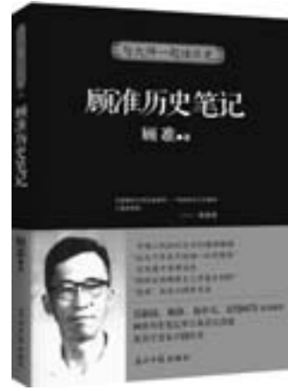
《顾准历史笔记》 顾准 著 光明日报出版社

此书是巴尔特去世后第一部全面梳理其思想源流的传记。传记不以叙事性的巴尔特生平为重点，也没有采用学院派的学术话语，而是以立意独特的散文体和细密而幽默的分析见重于巴尔特研究界，成为一本绕不开的别致的著作。