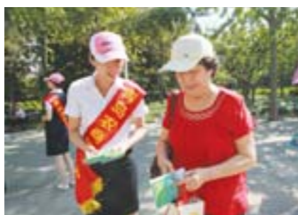
积极开展金融知识宣传活动。