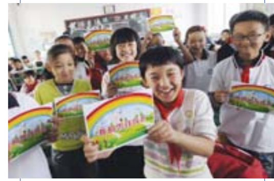
□李月明 报道 ▲10月9日,东营胜利农村合作银行辛店支行在东营区辛店街道中心小学为学生们上一堂“学做理财小达人”儿童理财课。本次理财课堂的开办旨在让孩子们学习理财懂得如何花钱,以及对其综合能力的培养。