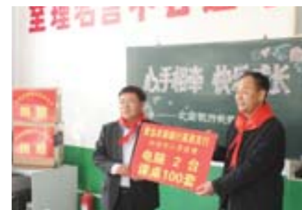
向莱西滨河小学捐赠2台电脑、100套课桌。