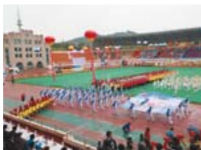
连续两届在青岛市银行业职工运动会上荣获团体总分第一名和精神文明奖。