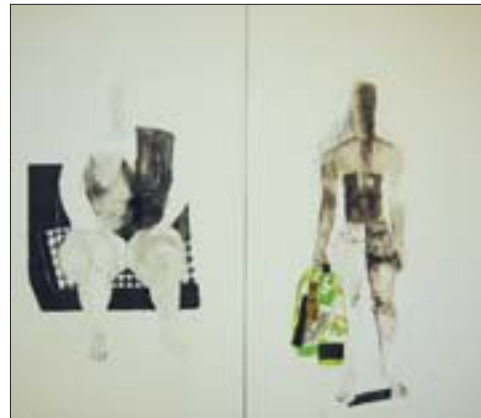
王玉华 路人系列 300cm x 300cm