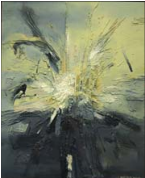
杨劲松 搅成团系列之二 200cm x 160cm