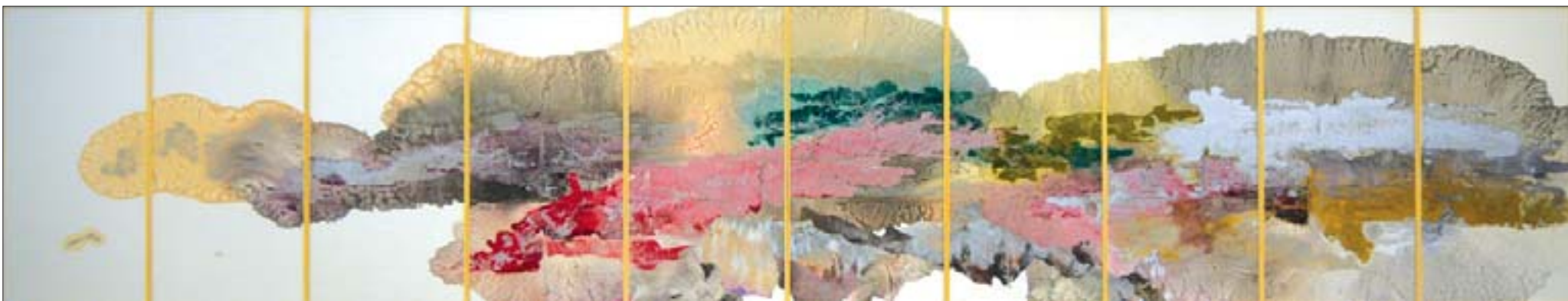
胡伟 西域祥云 138cm x 670cm