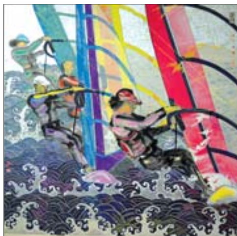
李济民 澎湃 190cm x 180cm