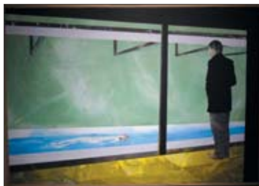
党震/宋忠山/杨士奎 触摸 140cm x 200cm