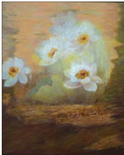
杜华 清和 250cm x 200cm