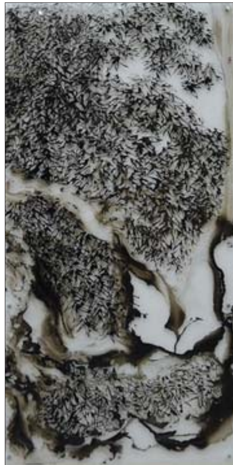
岳海波 竹影婆娑 200cm x 100cm