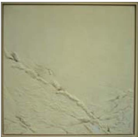
黄祺 境 200cm x 200cm