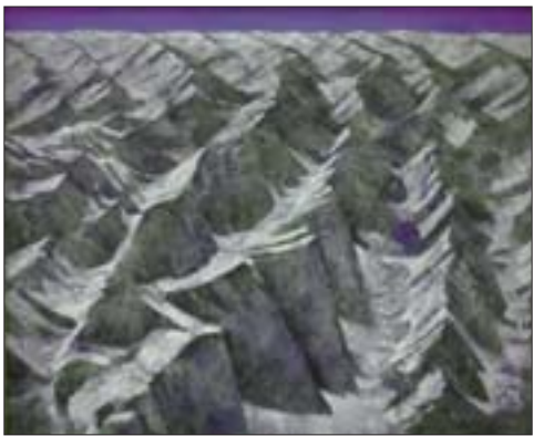
李耀林 长江之源 120cm x 150cm