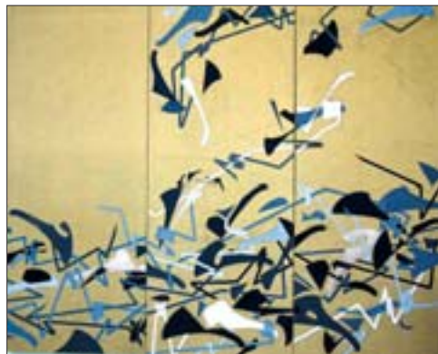
李飒 从左至上至下 250cm x 300cm