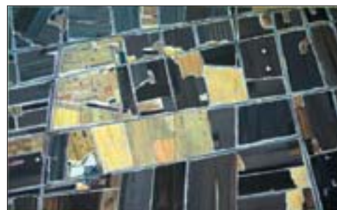
田卫平 地表系列25 200cm x 300cm