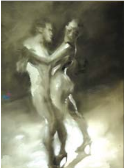
冯斌 黑白探戈之二 136cm x 100cm