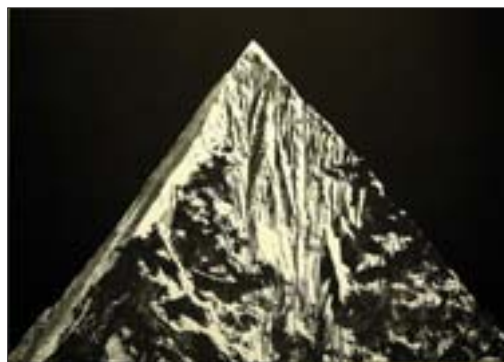
周墨 月光女神 200cm x 300cm