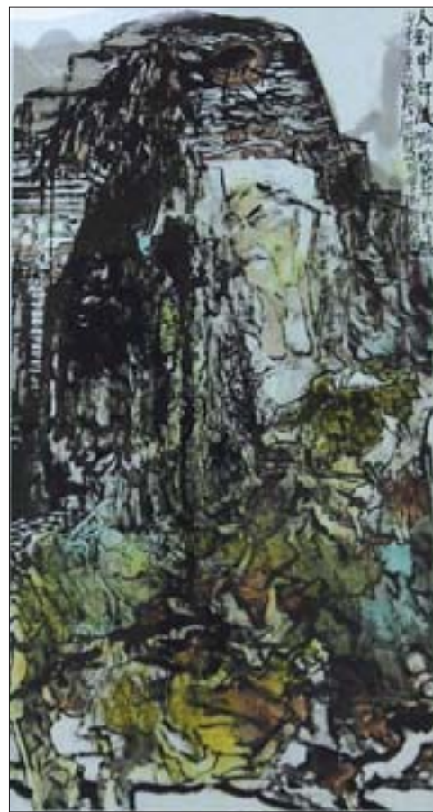
张志民 人到中年后 180cm x 97cm