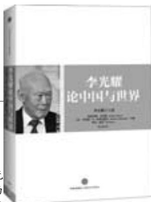
《李光耀论中国与世界》 就像是李光耀本人一样，睿智、坦率、思维缜密，这些言论也许会让读者感到震惊甚至有些不安，但会带来更加深远而持续的启发和灵感。

被意识形态眯住双眼，那么中国出问题的概率大概是20%。我并没有说这个概率是0，因为中国的问题比较严峻：制度变革、商业文化变革、反腐以及新思想体系的形成。