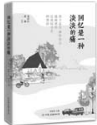
《回忆是一种淡淡的痛》 龙应台 等著 中国友谊出版社

本书借助生动有趣的人物故事和贴近生活的案例描写，全方位介绍中国的各个税种、中国税制与外国税制的区别与相同之处，以及中国税制改革中的种种热点问题。