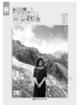
《转眼，青春散场》 叶冰伦 著 湖南文艺出版社

因为追念随风逝去的岁月，因为感怀永远不来的青春，也因为伤怀无法抚平的苦难，更因为要坚持前往，因此在书中不仅仅能够找到深藏于心灵深处的震撼，更能找回久违的温暖于心的梦想。