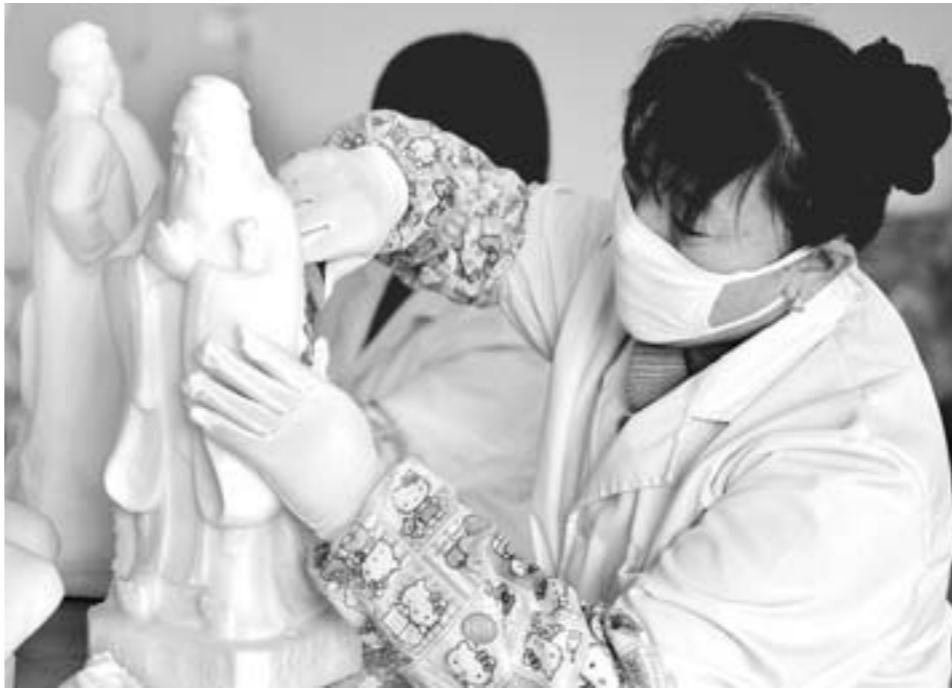
□蒋惠庆 曹志文 摄 △9月29日，无棣盐业公司的工作人员正在精心雕琢盐雕作品。

经济与文化相互促进，相得益彰，在无棣县得到充分体现。据县长丁海堂介绍，2012年，无棣县以全省第二名的成绩，被省委、省政府表彰为“县域经济跨越发展先进单位”。今年1—8月，全县实现地方财政收入7.6亿元。