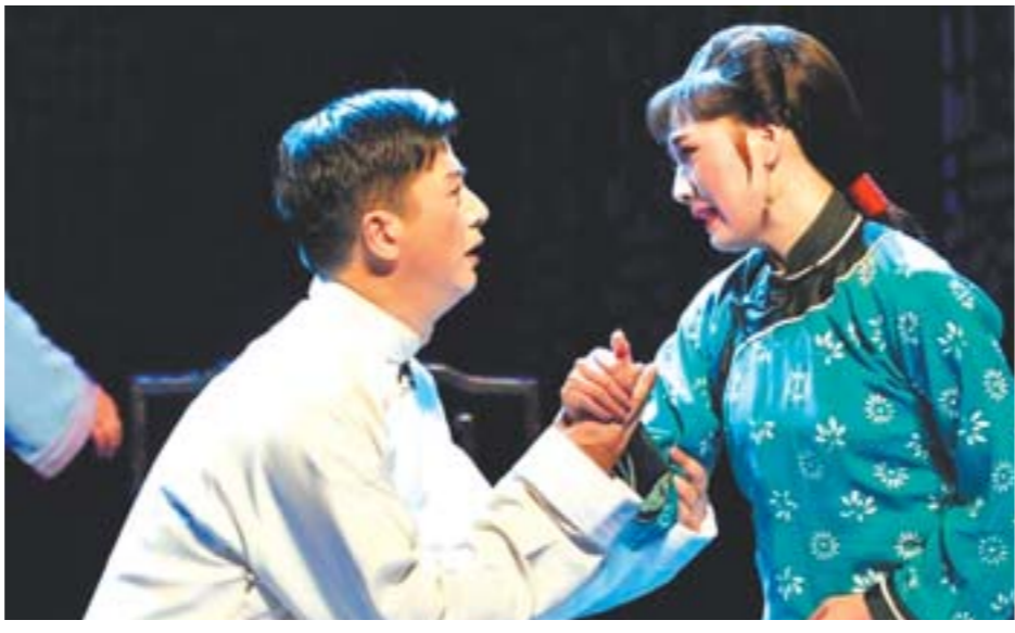
10月10日晚,由安徽省黄梅戏剧院排演的黄梅戏《雷雨》在山东大剧院上演。演员们的精彩演出不时引起观众的热烈掌声。