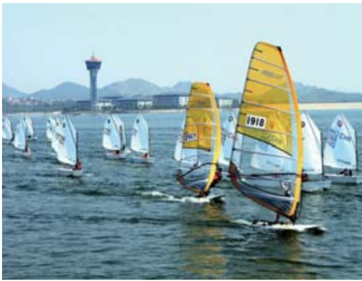
△雪野水上运动中心