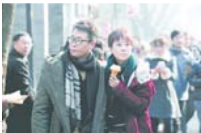
《抹布女也有春天》剧照