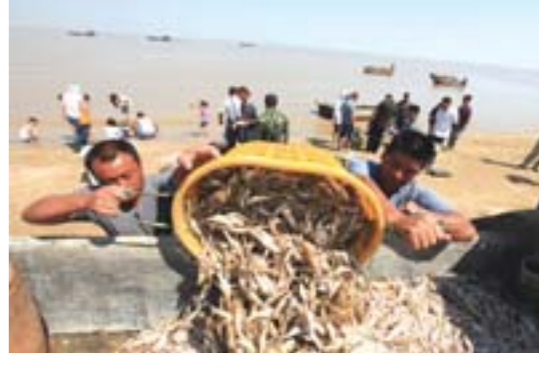
△为期3个月的渤海湾伏季休渔于9月1日结束,渤海湾渔民撒网捕鱼,出海捕捞。图为无棣县垦口镇汪子堡渔民打回开渔后的第一网鱼。