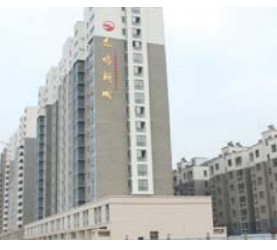
□刘芝杰 报道 <回迁房鹿鸣新城。