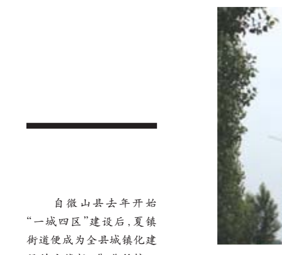
□刘芝杰 报道 <回迁房鹿鸣新城。