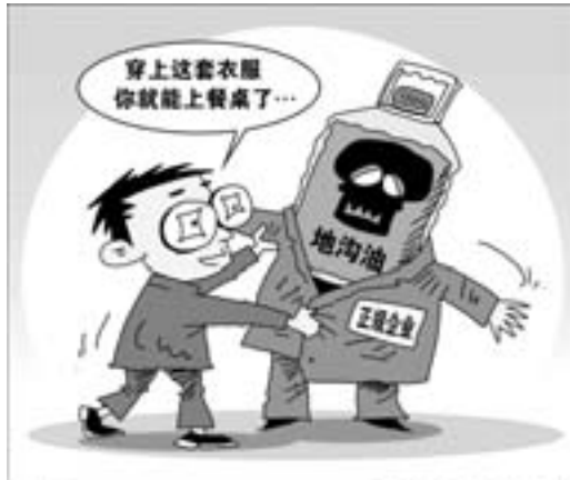
包装 新华社发 朱慧群 作

在庭审的间隙,记者来到康润公司被查封厂房。在这里记者看到7个储量在50吨左右的储油罐,全部用于储存毛油。这些毛油都来自于江苏、浙江、山东等地的屠宰场和小作坊,它们利用屠宰废弃物(包括猪皮、牛皮、羊皮上刮下的碎末、毛料)和一些变质的动物内脏熬制毛油。这种劣质油脂原本只能用于工业生产或动物饲料用油,却被康润公司大量收购用于制造新型“地沟油”。在该公司废弃的生产车间里,白土、包装袋、合格证散落一地,价值数千万元的成套炼油设备被用来制造“地沟油”。