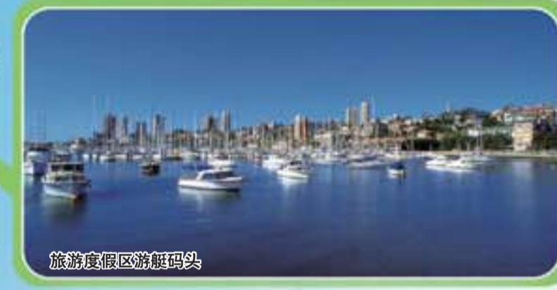
旅游度假区游艇码头