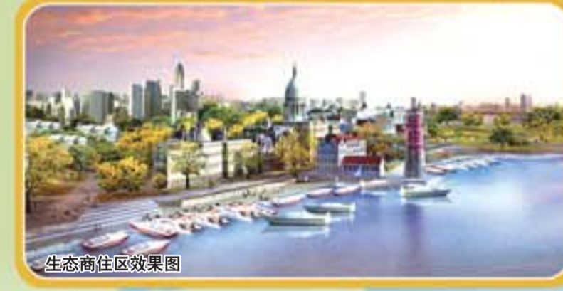
生态商住区效果图