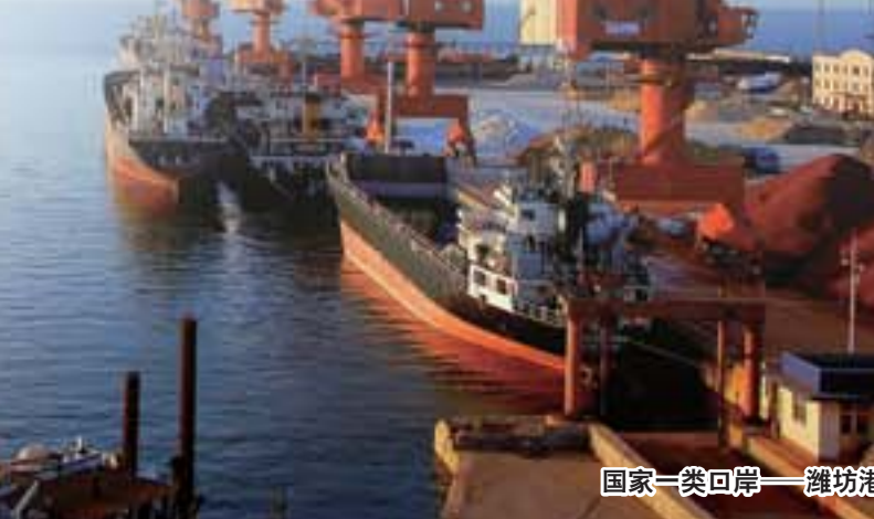
国家一类口岸——潍坊港

有则则灵，人类尚海。当国际高端人居生活成为人们追求的极高生活境界和目标的时候，国际高端人居带这个词因此而有“财富与智慧并得”的意味，追求国际高端人居生活是大众的梦想。潍坊滨海致力于打造滨海宜居宜业游商新城，具有极大的升值空间，正在建设的滨海新城生态商住区，其未来前景是家家通车、户户通船，开窗见绿、伸手钓鱼。