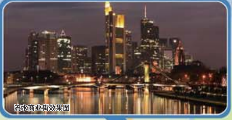
流水商业街效果图