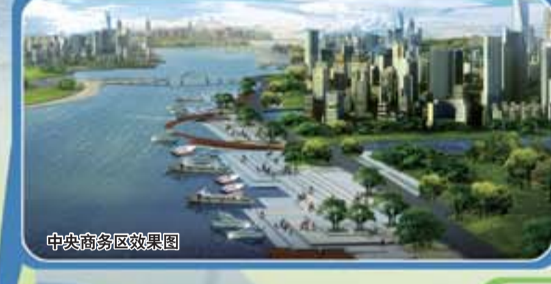
中央商务区效果图