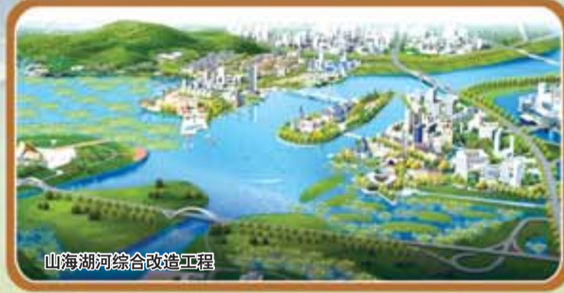
山海湖河综合整治工程