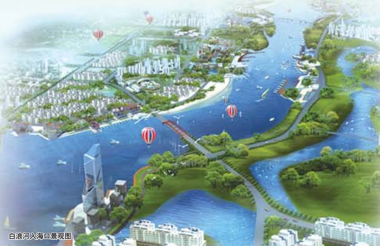
白浪河入海口实景图

在潍坊向北的半小时生活圈，你可以去滨海海水浴场、白浪河口看白浪逐沙，可以去滨海情人湾享受吃住玩一体的极致服务，可以去北海渔盐文化馆看渔盐文化，可以去海洋公园赏海洋风情，可以去海边游艇时光……深蓝生活真的不必去远方。