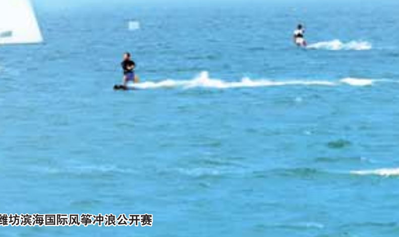
潍坊滨海国际风筝冲浪公开赛

滨海新城或与热情开放的滨海气质相辅相生，或与典雅脱俗的大海风情水乳交融，或与一城海景半城湖的生态美景完美共生……无疑都是深蓝梦想与传统、文化的碰撞和升级，让每一个人心中对滨海得以成真。我们相信，深蓝梦想已然在潍坊北部海岸线上发生生长。