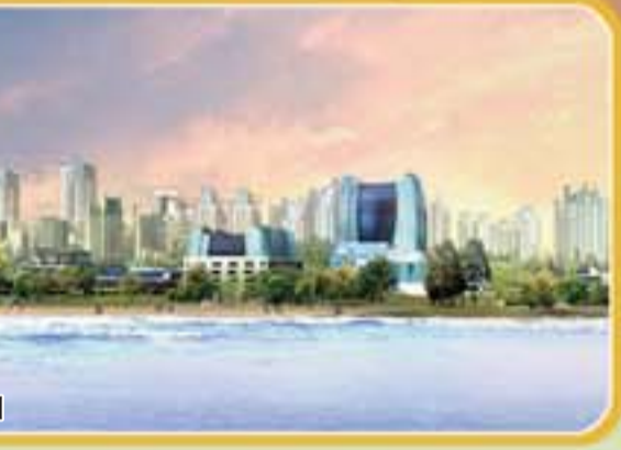
科教创新区效果图