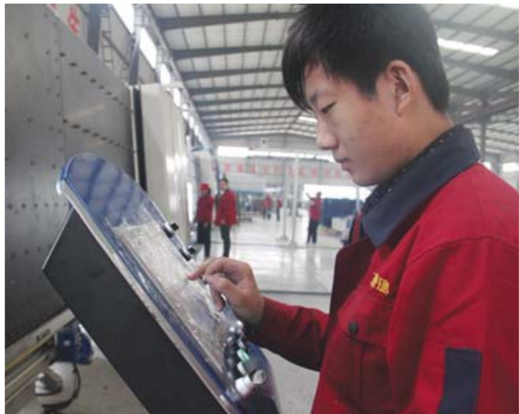
□王兆锋 张栋 报道 在平维斯德铝铝业公司，投资3000万元新上一套“立式粉末喷涂生产线”，减少了30%的人工，效率提高了5倍，有效解决了产品暗纹等质量问题，产品订单增加很快。

科技创新型企业培育和科技小巨人计划，培育科技型中小企业群体。仅去年，该县就拿出2906万元资金，实施各类技改、创新项目150多项。据统计，全县科技型中小企业发展到130家，去年这些企业产值、利税分别比上年增长40%和56%，高于全县工业平均水平21个和30个百分点。 中小企业成为科技创新的主体。由在平时发汽车零部件公司自主攻关、开发出的“铝合金复合钎焊铝箔”产品，广泛应用于热交换、水冷散热及汽车空调，打破了国外企业垄断，先后荣获国家科技进步奖、国家发明专利和国家发明奖。鲁环散热器的汽车尾气净化器产品，使汽车尾气排放标准达到欧4标准，产品全部销往欧美。仅去年，该县中小企业就开发出235个新产品，其中4项技术填补了国内空白，200多项国内领先科技成果得以转化应用。 在发展科技型中小企业过程中，在平县注重与县内铝、密度板等传统产业相结合，在扶持科技型深加工中小企业上下工夫，着力促进传统产品的就地深加工转化。以前当废料处理的纳米级铝粉末，经过特殊工艺膨松，添加石墨、冰晶石粉末及特种元素，形成了晶粒状固体燃料，其能量密度与火箭发动机的燃料相当，这一高科技产品给企业带来可观收入。科技创新对全县经济增长的贡献率达到43%，高新技术产业产值占规模以上工业比重达到27%。涌现出中国驰名商标4个、省著名商标7个、中国名牌产品2个、省名牌产品32个。