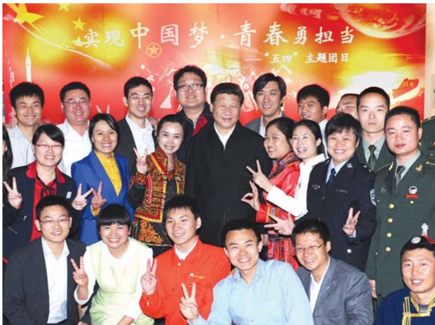
5月4日，中共中央总书记、国家主席、中央军委主席习近平来到中国航天科技集团公司中国空间技术研究院，同各界优秀青年代表座谈并发表重要讲话。这是座谈会前，习近平和在展厅参观的优秀青年代表合影。

为实现中华民族伟大复兴的中国梦而奋斗，是中国青年运动的时代主题。用中国梦打牢广大青少年的共同思想基础，用中国梦激发广大青少年的历史责任感，让更多青少年敢于有梦、勇于追梦、勤于圆梦，让每个青少年都为实现中国梦增添强大青春能量。