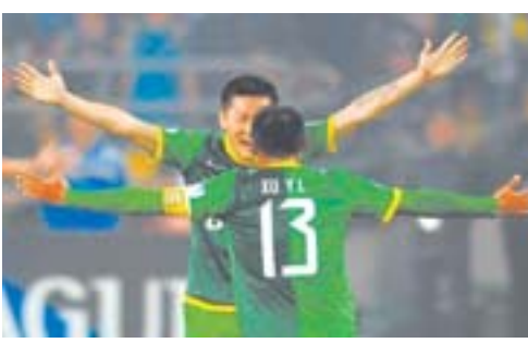
亚冠：国安告捷 人和战平

前四轮1胜3平，绿城队开局不错，主教练冈田武史对球队的改造取得了效果。然而喜悦并没有持续多久，绿城队就遭遇了前两连败，上轮客战