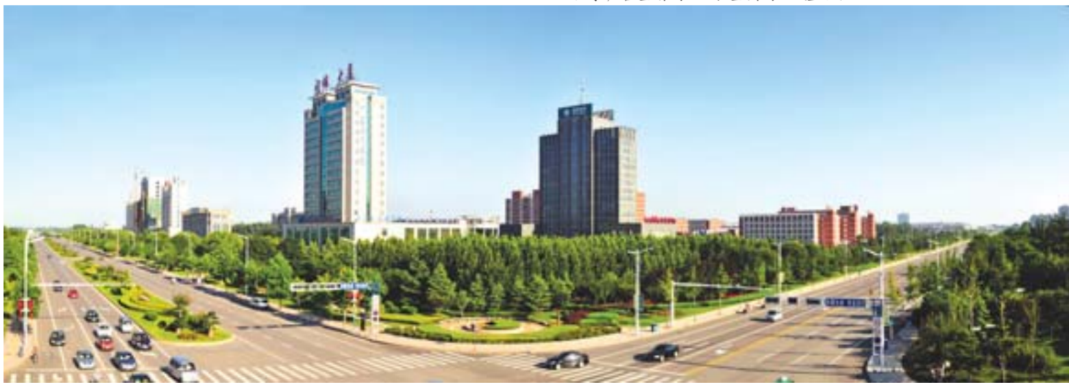
△快速崛起的城东新区。