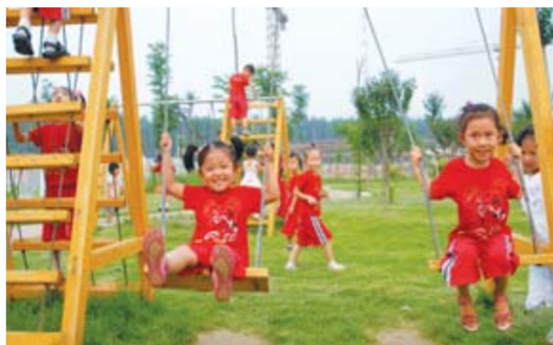
△设施齐全的标准化工厂。