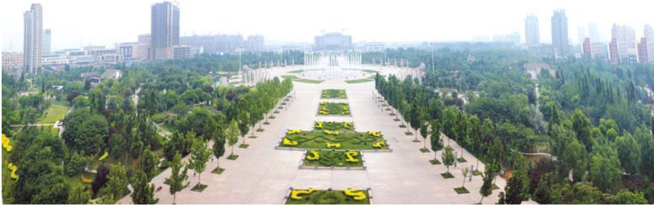
△绿树环绕的乐安公园，市民休闲的好去处。

近年来，广饶县围绕转方式、调结构这条主线，深入实施黄蓝国家战略，坚持走新型工业化道路，引导企业瞄准行业前沿、高端产品，打造了一批产值过百亿元、千亿元的产业集群，经济运行平稳健康，综合实力跃上新台阶。2012年，全县实现生产总值607.3亿元，完成地方财政一般预算收入27.2亿元，综合实力位居全国百强县第57位、全省科学发展综合实力第12位。