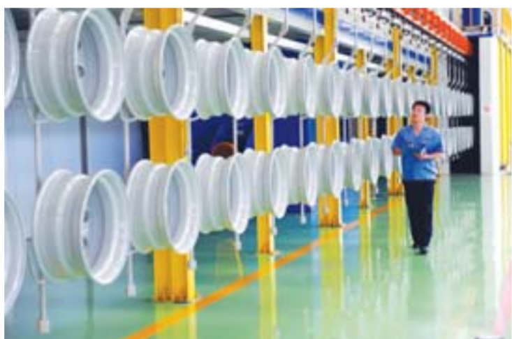
△广饶是全国汽车零部件出口基地和摩擦材料研发制造基地。

环境是最稀缺的资源，生态是最宝贵的财富。自去年以来，该县敲定实施了103项环保工程，从预防、减排和治理三个方面展开了对环境治理的全方位“围剿”，对164家企业进行停产治理，依法取缔“土小”污染企业84家，拒批不符合节能环保标准项目44个，有效杜绝了新的污染源的产生，保证了绿色生产。同时，出重拳淘汰落后产能，全县有11家企业淘汰落后产能，年可节约标准煤8.5万吨。今年，广饶县吹响了发展循环经济、追求绿色增长的号角，向着争创国家级生态县和中国人居环境奖的目标阔步前行。