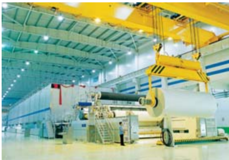
△广饶是全球单厂规模最大的新闻纸生产基地。