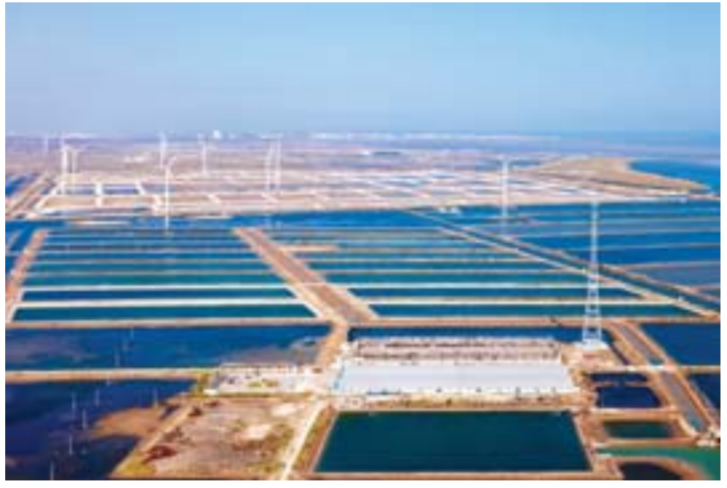
△全国最大的单片海参养殖基地

2012年，全市实现生产总值3000.7亿元，比上年增长12.1%，增速居全省第三位；规模以上工业总产值、主营业务收入双双突破万亿元，公共财政预算收入达到158.7亿元；固定资产投资、进出口总值、服务业增加值、金融机构贷款余额等指标增幅位居全省前三；城镇居民人均可支配收入30953元、增长13.2%，农民人均纯收入11489元、增长14.6%。预计今年一季度，实现生产总值780亿元，同比增长11%；固定资产投资290亿元，增长20.5%；公共财政预算收入41.27亿元，增长10.6%。