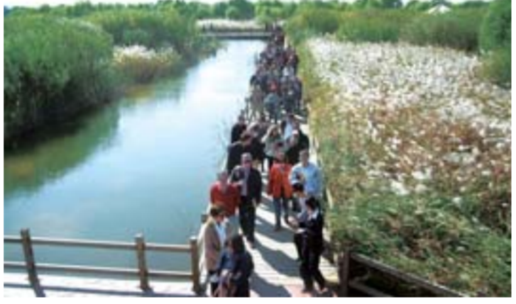
△黄河口生态旅游区