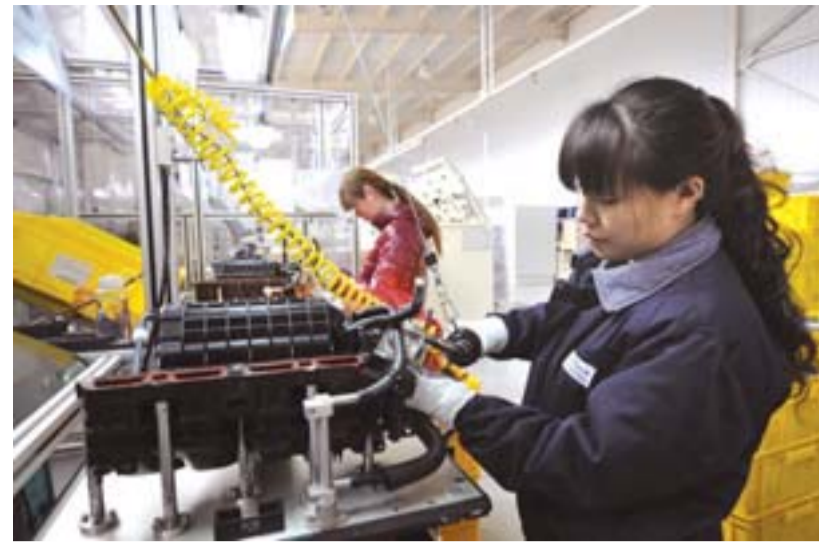
△威亚配套企业——阿泰克汽配

现代岱姆斯汽车传动系统(日照)有限公司由韩国现代集团子公司岱姆斯公司投资建设,项目一期总投资6300万美元。2011年5月开工建设,2012年3月投产,建设有SUV车用后驱动桥(10万台)、商用车变速器(6万台)、5档手动变速器(6万台)、电子式分动器(8万台)14条生产线。主要为北京现代、东风悦达起亚、资阳现代商用车及国内外的其它整车厂供货,是汽车动力系统中的核心零部件。2012年实现销售收入1.8亿元,净利润1960万元,税收450万元。2013年预计实现销售收入5亿元。项目二期计划投资6000万美元,于今年下半年开工建设,新增手动变速箱等产品30万台,明年年底建成投产,届时生产规模将比目前增加一倍,年销售收入达到10亿元以上。