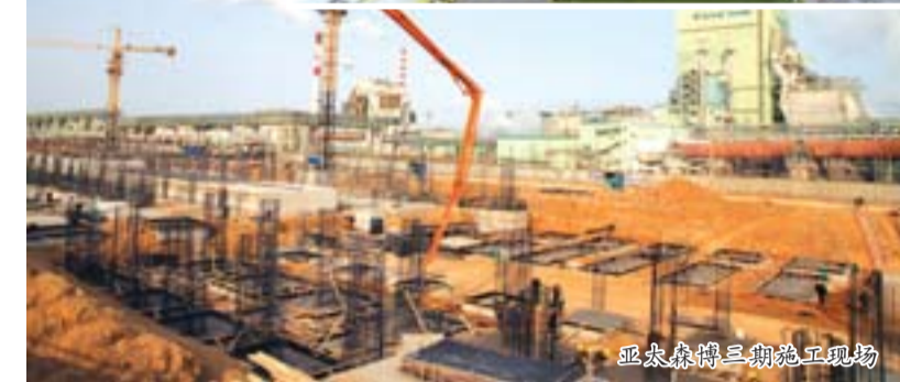
亚太森博新建生产现场

山东亚太森博浆纸有限公司由新加坡金鹰集团投资兴建,是山东省改革开放以来最大的利用外资项目。一期项目投资37亿元,二期项目投资11.3亿元,建有年产100万吨目前世界上最大的单条制浆生产线,主要工艺设备均达到世界领先水平。二期项目环保投资达30.3亿元,占总投资的27%,主要指标达到世界一流水平。2013年可产木浆185万吨、纸116.5万吨,实现产值78.2亿元、利税4亿元。