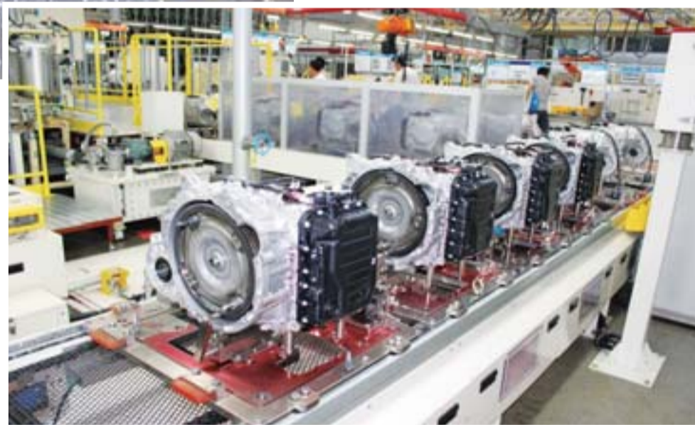
▷现代派沃泰自动变速箱一工厂生产线