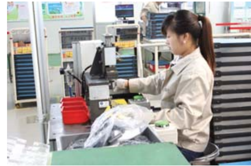
△威亚配套企业——裕罗电子