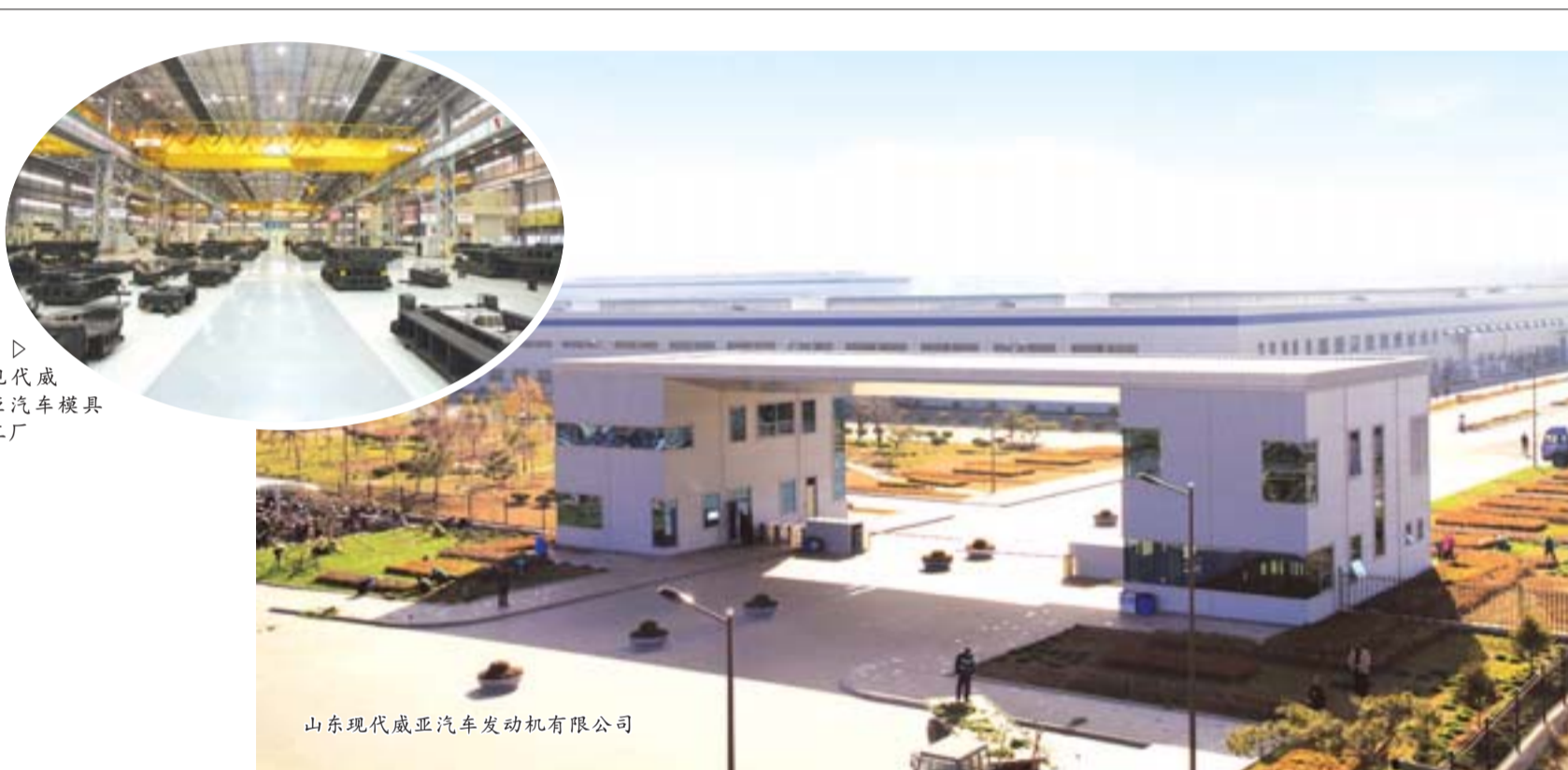
▷现代威亚汽车模具工厂

——品质追求,永无止境。在品质上追求极致,是现代汽车发展的核心,也是其长期秉承的经营哲学。也正是这种理念,推动着现代汽车逐步走出靠廉价取胜的阴影,成为今天全球汽车行业的巨头。如今这一理念也成为该区本土企业学习和努力的方向。最近,山东双港活赛有限公司正在对新引进的检测设备进行调试,作为一家专门为知名汽车制造商配套的企业,双港以前的产品检测只停留在人工检测阶段。改变来自于他们到威亚等企业参观带来的震撼——精细到极致的现场管理背后,是企业对品质的不懈追求。该区发起本土企业“向威亚等先进企业看齐”活动,学习其追求极致、不断超越的精神。 ——科技创新,驱动未来。威亚等外企非常注重研发投入,产品都具有自主知识产权,附加值和科技含量高。从最初的α、β发动机到γ发动机直至最新的nα发动机,产品一直在不断更新换代,表现出强劲的创新能力。以裕罗电子为例,统计数据 displays,开发区境内本土企业的利润率一般保持在5%左右,而裕罗的利润率超过了20%。高额利润的背后,是他们对自己自主知识产权100%的掌控。同属现代汽车集团的凯菲克公司只有18名员工,去年销售额达到12亿元,连续三年实现50%以上的增幅,成为全球汽车控制系统领域的领军企业。以科技创新为依托的现代思维理念在日照迅速蔓延开来,“生产一代,研发一代,瞄准一代”的创新理念,带动着传统产业转型升级阔步向前。