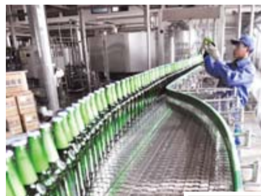
青岛啤酒(日照)有限公司包装生产线

凌云海糖业集团主要从事食糖精炼、加工、销售、仓储,现有食糖精炼加工能力为120万吨,2012年实现产值67.93亿元、利税2.1亿元。公司“凌雷”商标荣获中国驰名商标,新上120万吨/年食糖精炼加工项目,总投资15.6亿元,主要建设精炼车间、编织袋车间、原糖仓库、包装车间等,已于今年3月底投产,投产后可实现产值82亿元、利税5.8亿元。届时,凌云海糖业集团食糖加工能力将达到240万吨,占全国食糖加工总量的七分之一,成为世界上最大的单体系糖加工企业,集团全部产值达300多亿元、利税30多亿元。