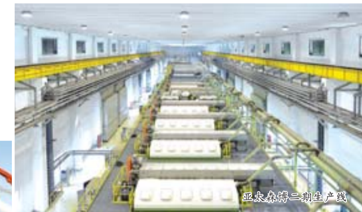
亚太森博二期生产线