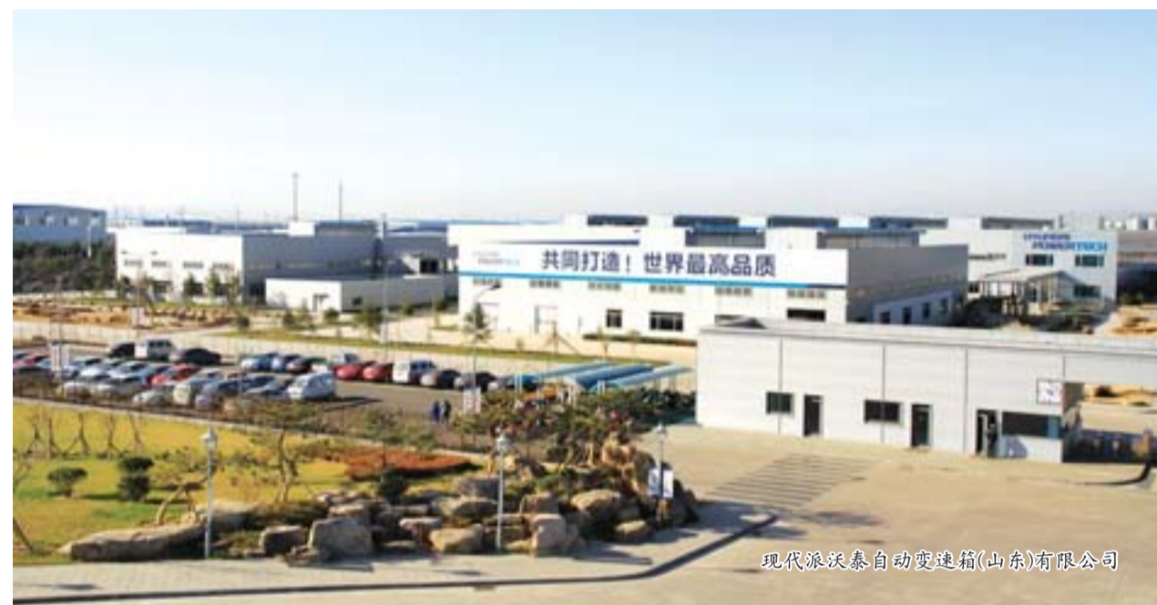
现代派沃泰自动变速箱(山东)有限公司