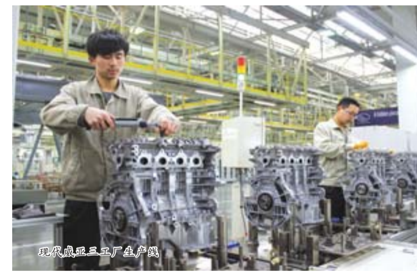
现代威亚工厂生产现场

山东现代威亚汽车发动机有限公司由韩国现代汽车集团的威亚株式会社、现代汽车株式会社、起亚汽车株式会社与日照港(集团)有限公司共同投资成立,总投资14.85亿美元,是目前全省装备制造领域利用外资最大的项目,是全国最大的专业轿车发动机生产企业,主要为现代汽车集团海外工厂配套。目前,已建成发动机一工厂、二工厂、三工厂,毛坯一工厂、二工厂、三工厂,缸体曲轴工厂7个工厂,具备了发动机78万台、毛坯120万件、缸体曲轴120万件,变速箱壳体40万件的年产能;2012年生产发动机55万台,实现销售收入68亿元、利税10亿元。2013年预计销售收入超过80亿元。