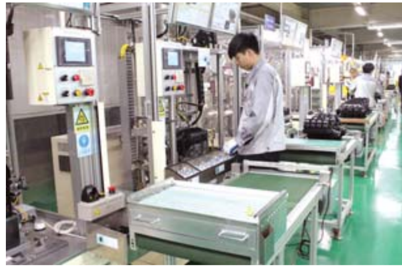
△威亚配套企业——凯菲克汽配