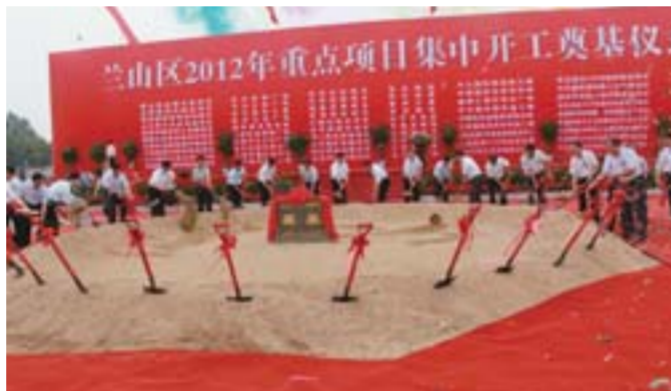
△兰山区总投资296.5亿元的57个重点项目集中奠基

以技术创新增强“兰山制造”的核心竞争力，主动淘汰落后产能。兰山区积极引导重点工业企业与高等院校、科研院所开展产学研合作，加大创新投入，完善创新体系，推进科技成果转化。新港集团与南京林业大学合作，建立了全国同行业唯一的院士工作站，被认定为国家中小企业公共服务示范平台、山东省企业技术中心、山东省木质复合材料研究与测试公共服务平台。兰山区还设立2000万元过桥资金、500万元技改资金奖励技术创新，大力推进工业化、信息化“两化融合”，促进产业结构优化升级和企业管理效能提升。今年，兰山区力争高新技术企业达到30家，新增高新技术产品100个以上，高新技术产品产值占规模以上工业总产值15%以上。借助技术创新，兰山区积极落实工业节能目标责任制，实行新上项目能源评估制度，加快淘汰落后产能。