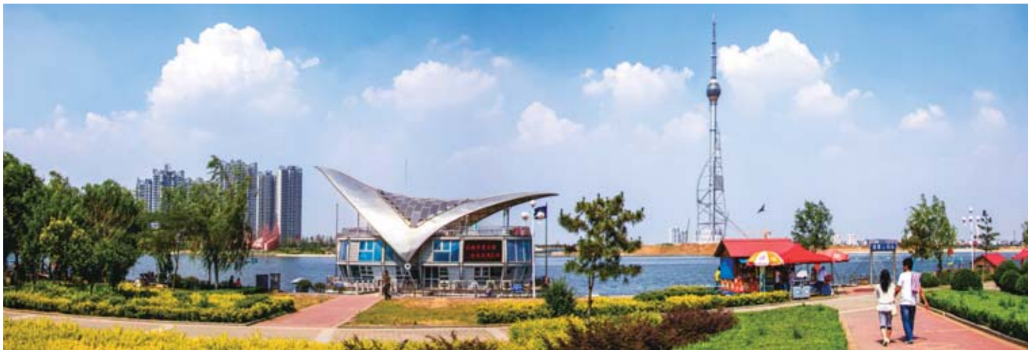
△滨河大道风景如画