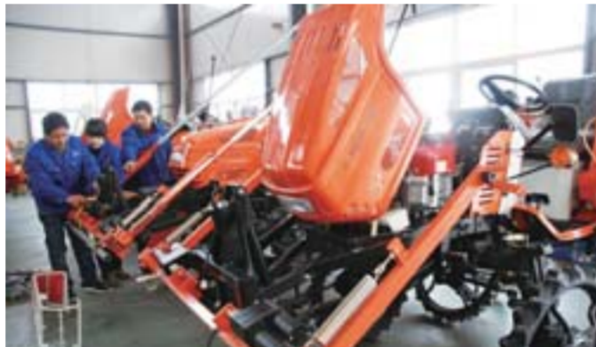
△三禾永佳大型植保机械组装车间