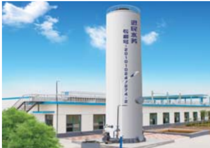
△金锣集团研制的塔式污水处理设备