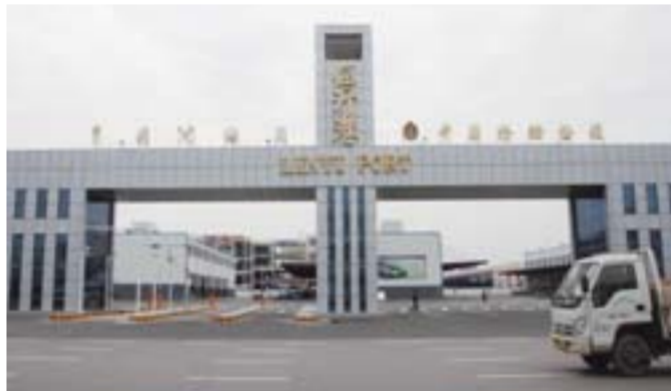
△内陆“无水港”——临沂港4月21日开港试运营