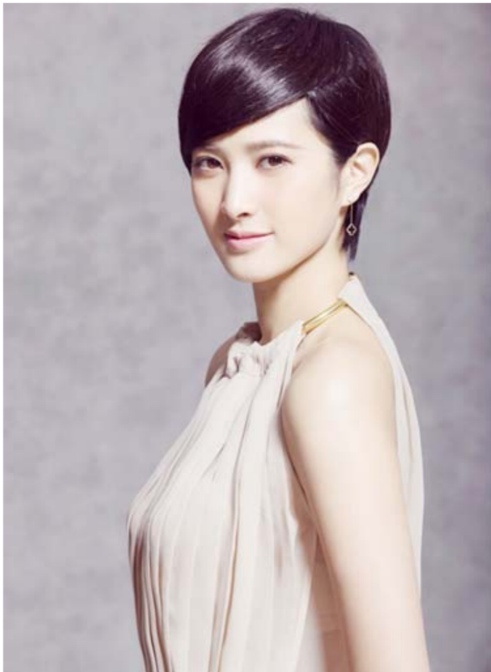
演员隋俊波近日曝光一组写真。片中，她一袭裸色雪纺裙，尽显优雅气质。

说到片酬，他认为，片酬不是演员能说了算的，而是由市场、观众决定的。制片方给多少，演员一般都接受。现在好演员很多又不是住房那样的刚性需求，演员可选择的余地太大了。“塑造人物是我本分的工作，如果整天想着涨片酬的事，那就塑造不好人物了。”