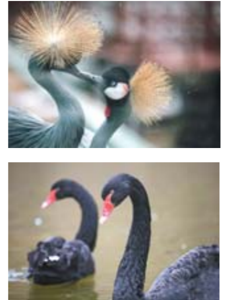
蛇年农历大年初五与西方的情人节恰为同一天,南京红山森林动物园里也充满了浪漫气息,动物们出双入对,亲密无间。 上图从左至右,从上至下分别为火烈鸟、鹦鹉、猴子、戴冕鹤、黑天鹅。