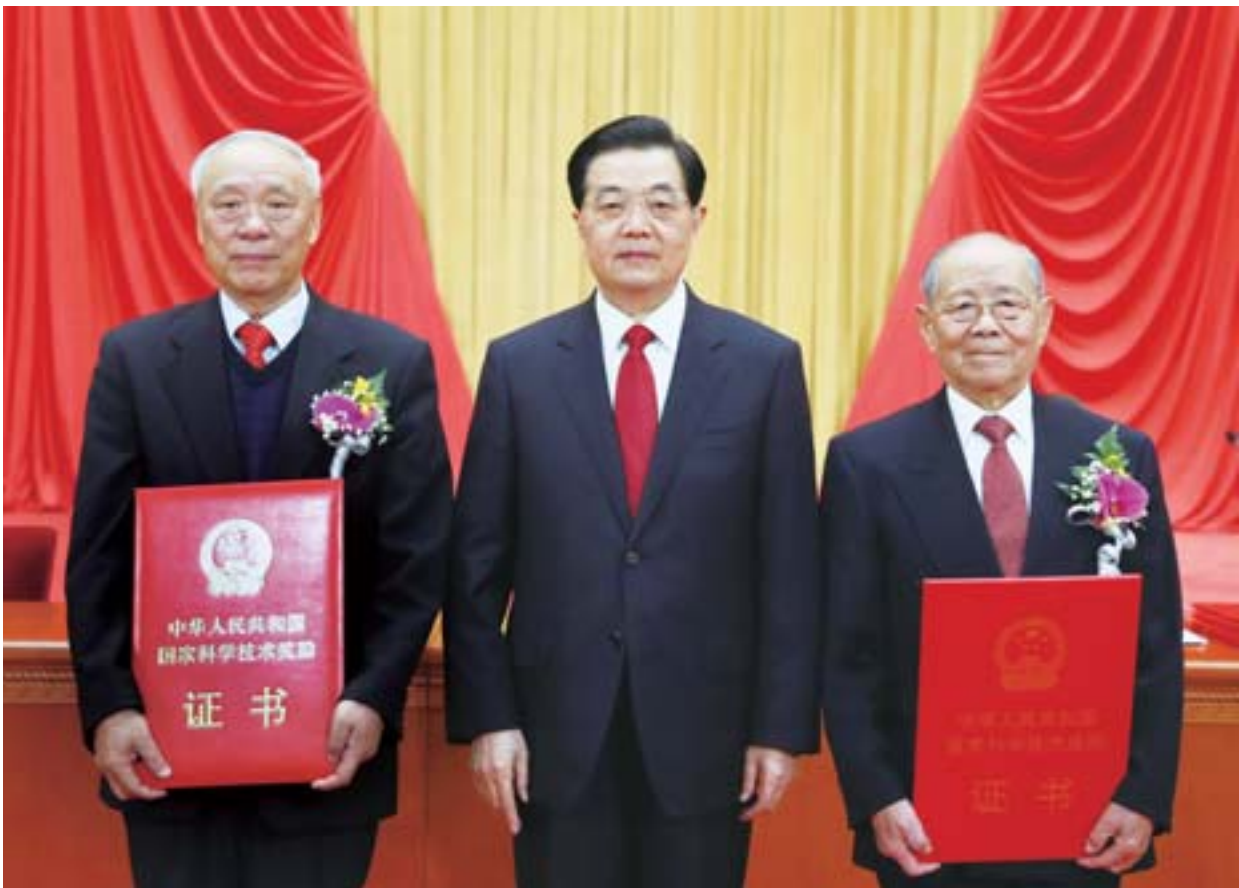
国家主席胡锦涛向获得2012年度国家最高科学技术奖的郑哲敏(右)和王小谟(左)颁奖。

□滕教斋 郑轩 报道 本报济南1月18日讯 今天上午,全省组织部长会议在济南召开。省委书记姜异康会前提出要求。省委常委、组织部长高晓兵出席会议并讲话。 姜异康指出,党的十八大以来,全省组织系统认真贯彻中央和省委的决策部署,坚持跟着中心走、贴着中心做,以创先争优精神做好组织工作,取得了新的成绩。他强调,要深入学习贯彻党的十八大精神,学习领会全国组织部长会议精神,改革创新,积极进取,推动组织工作有新作为,为加快建设经济文化强省提供坚强组织保证。要认真抓好党的十八大精神的学习培训,引导党员干部进一步坚定理想信念。要在中央统一部署后,扎实开展好以民务实清廉为主要内容的党的群众路线教育实践活动,要着力建设高素质执政骨干队伍,进一步加强领导干部作风建设,要以基层服务型党组织建设为抓手,不断提高服务群众的能力水平。要统筹推进各类人才队伍建设,为转变方式调结构提供人才智力支持。要以更高标准改进工作作风,把组织部门和组工干部队伍建设提高到新的水平。 高晓兵在讲话中强调,要认真落实中组部和省委部署要求,牢牢把握为民务实清廉主题,围绕中心、服务大局,改进作风、改革创新,进一步提高组织工作科学化水平。要认真学习总结党内历次教育活动的经验,抓好群众路线教育实践活动。要进一步深化作风建设,抓住亟需解决的问题开展培训,充分发挥精品示范班次的集成创新效应。(下转第二版)