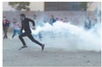
▲示威期间, 埃及开罗解放广场上的示威者躲避催泪弹。