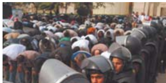
▲12月2日, 防暴警察在埃及首都开罗的最高宪法法院外待命。