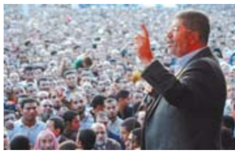
▲11月25日, 埃及总统穆尔西发表声明, 表示自己手中的权力只是“暂时”的, 并寻求政治对话。