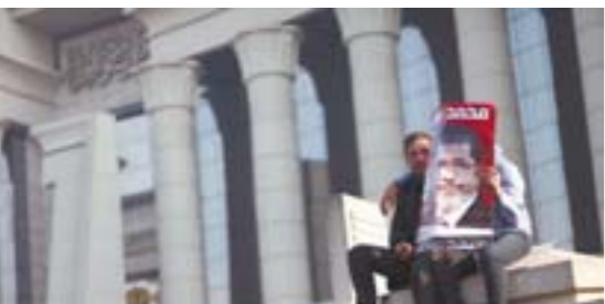
▲12月2日, 在埃及首都开罗的最高宪法法院外, 支持者拿着总统穆尔西的画像参加集会。

当然, 一个没有东方文化背景的读者, 或许看法会与我有很大差异。不过我仍然认为, 因为有了这匹马, 这幅照片才成为一幅难得的佳作。摄影不同于绘画, 绘画, 可在画面中添加任何想要的东西; 而摄影, 要得到想要的东西, 要么靠等, 要么靠“天成”。我相信, 这幅照片, 就是天成之作。