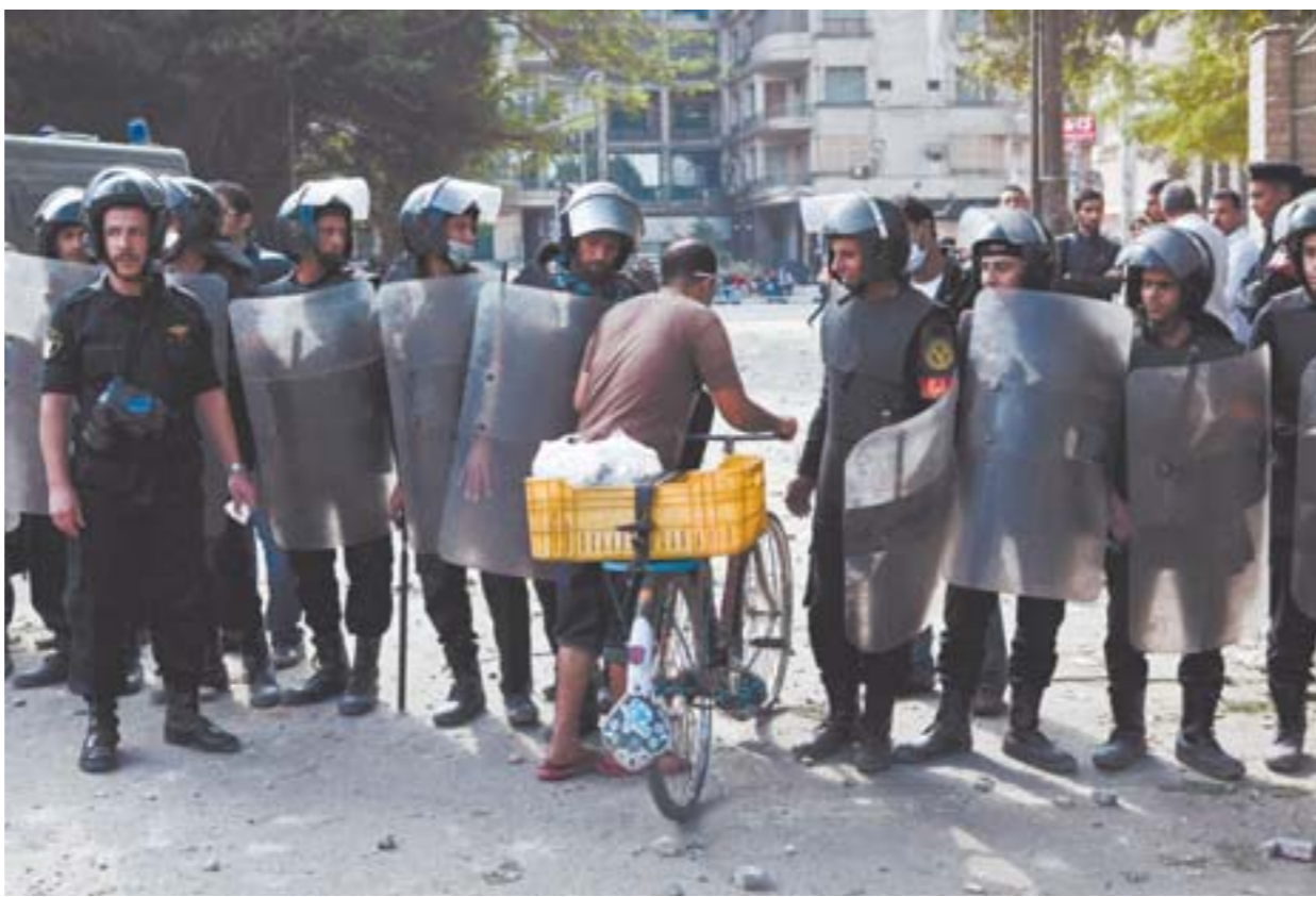
▲11月28日, 在埃及开罗的塔利尔广场上, 在抗议者与防暴警察的冲突间歇, 一位埃及人推着自行车通过警戒线。