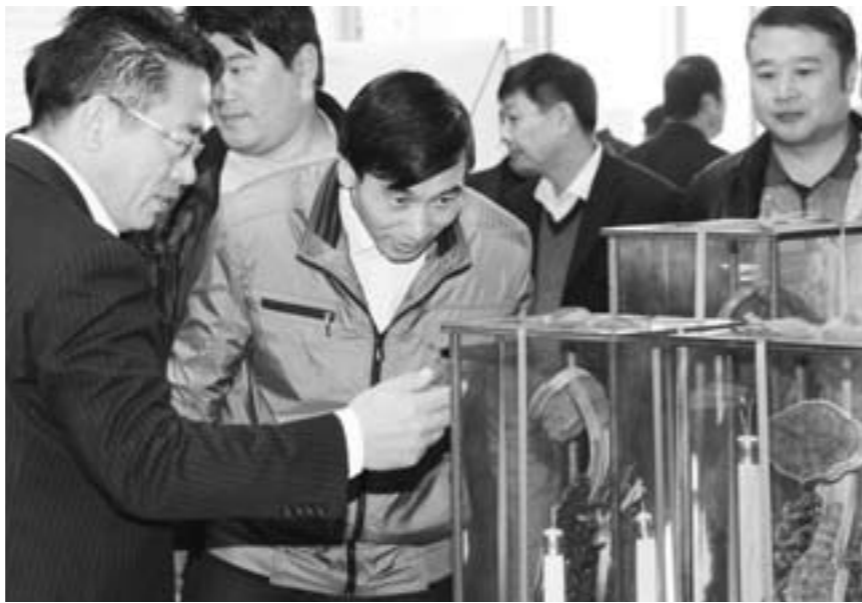
▲特色文化产品吸引了不少参观者驻足观赏。

济宁文化颇具特色,如何以特取胜,从而将资源优势转化为产业优势是目前亟需解决的问题,记者在采访中发现,济宁特色文化产品的产业化发展水平参差不齐,有的价值和规模逐步提高和壮大,有的因诸多原因还没有实现量产,只靠技艺传承人单打独斗、苦心经营,前景不容乐观。为了传承文化,壮大产业规模,济宁文化产品的全面发展和提高尤为关键。