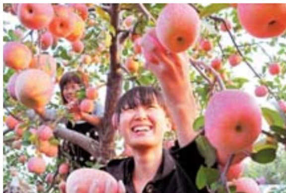
△沂源红苹果乐游客