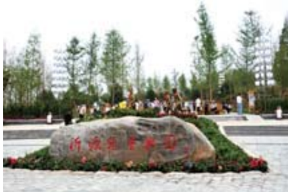
△儿童快乐成长的乐园