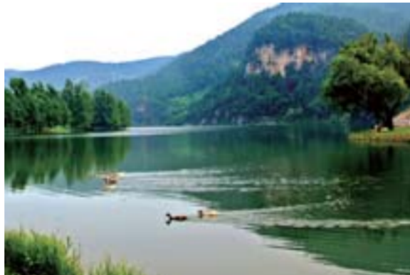
△中国牛郎织女传说之乡风景