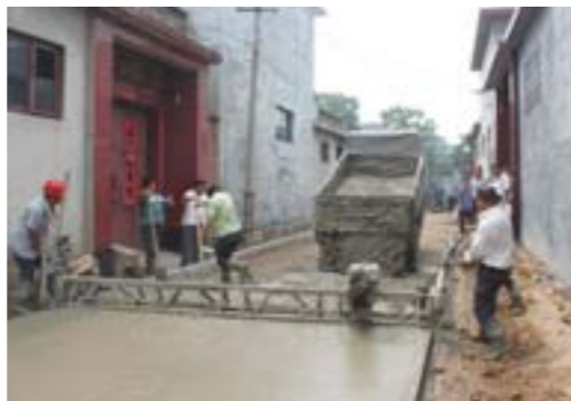
▲“村内通”道路硬化高标准实施。