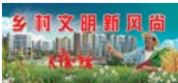
□文/图 孟一 梅花

从2011年起至今，曲阜累计新修农村公路近两公里，下水管道、道路标识、环卫设施、养护队等配备齐全，从征集资金、管理模式、道路建设模式等方面收获了丰富的经验，这也成为济宁全盘启动的乡村文明建设道路“三化”的有益探索。