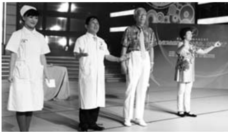
▲山东省中医院报送小品《情缘》

晚会现场，观众们久久沉浸在艺术的魅力中，无不为真实的情节、亲切的场景、感人的事迹所动容，许多人流下了感动的泪水。晚会同时对近年来我省卫生系统涌现出的先进典型代表进行了表彰，使在场的每一位医务工作者都深受鼓舞。观众们普遍认为，这次晚会不仅是对优秀医务工作者的赞颂和褒奖，更是对整个行业的激励和鞭策。它的成功举办，拓宽了山东国际大众艺术节运用艺术服务人民的渠道，丰富了“艺术走近大众”的内涵，让更多的人能通过真实、饱满的事迹走近医生、理解医生，在温馨和谐的氛围中，构架起医患互信的桥梁。