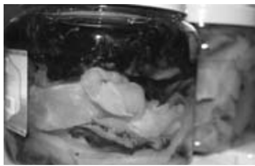
▲威海特色海产品加工

海蜇是威海荣成海域特产，在漫长的生产实践中，荣成渔民创造、摸索、积累、总结出了一整套的“三矾海蜇”传统加工技艺，并流传至今。