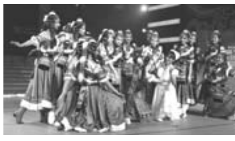
▲山东省立医院报送舞蹈《雪域之光》

丰富多彩的文体宣传活动，把文化建设落到实处。组建医院“天使艺术团”、“老干部艺术团”，重大节庆组织文艺汇演，活跃并引领着职工文化生活。还编辑出版了展现德艺双馨的优秀专家风采的《大医之魂》系列丛书等，营造出浓厚浓郁的文化氛围，医院的整体文化深入人心，为实现建设现代化一流医院的目标不断积蓄起新的力量。