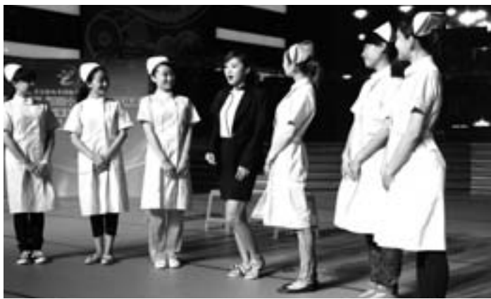
山东大学第二医院报送表演《青春姊妹花》