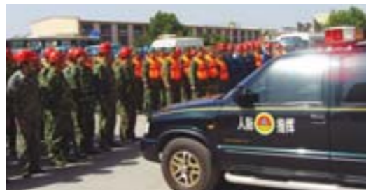
▲兖州人防专业队伍。