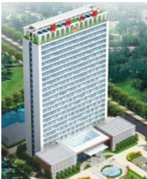
▲兖州人防综合办公大楼效果图。

改革开放以来,兖州市人民防空以改革创新为动力,以人防法律法规为保障,积极贯彻“长期准备、重点建设、平战结合”的方针,在组织指挥、人防工程、通信警报、人防执法、宣传教育、平战结合、机关建设等各方面,强化措施,创新实践,走在了省内县级城市的前列,多次受到省人防办和济南军区人防办的表彰。