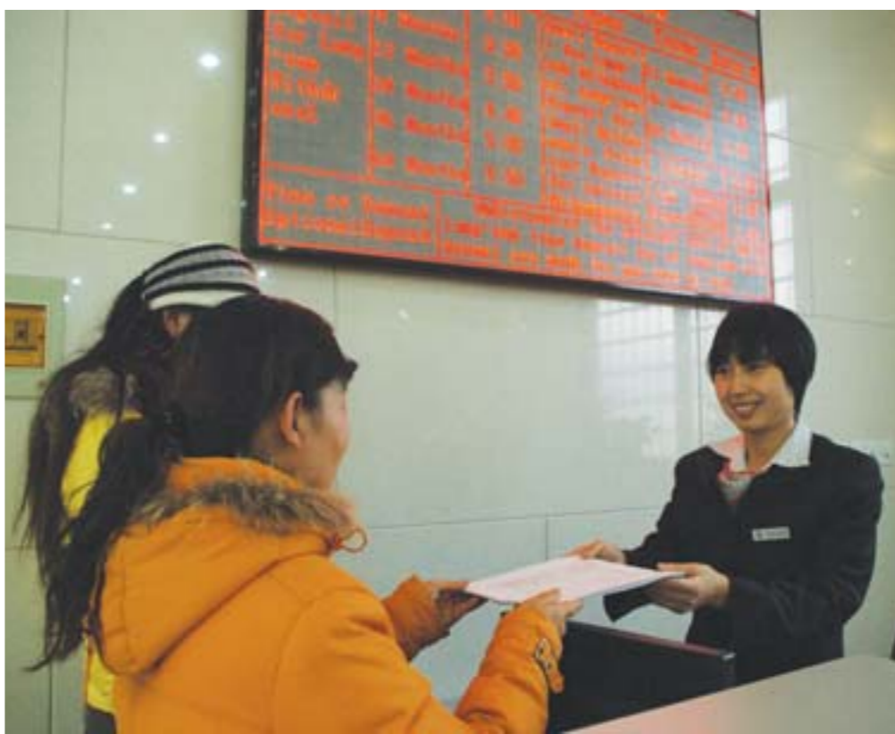
▲中行兖州支行员工真诚为客户服务。

磨砺硬功夫在兖州支行上下形成了共识。一天早晨,员工在上班时突然发现在“文明园地”上,突然增加了“曝光台”;在营业大厅的醒目处挂上了“投诉箱”;在中国银行网站开