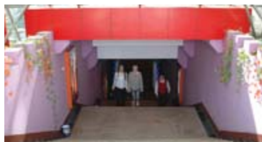
▲兖州人防民防工程。