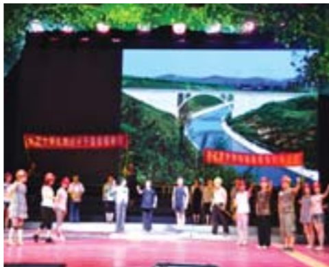
△《一江清水向北流》剧照

建设南水北调工程，是党中央、国务院根据我国经济社会发展需要作出的重大决策，是一项造福当代、惠及后人的宏伟事业。如何表现这一伟大工程，该剧从大处着眼，小处入手，从东线穿黄隧洞写起，从几个坚守在穿黄隧洞的老工人诉说着对南水北调的期盼之情拉开序幕，视角独特，感人情深。表达出正是有了以穿黄隧洞留守人为代表的普通水利工作者长达几十年的坚守奋战，几代人的忘我奉献，南水北调才有了蓝图，才由蓝图变为现实，才梦想成真。可以说，南水北调工程从构想到