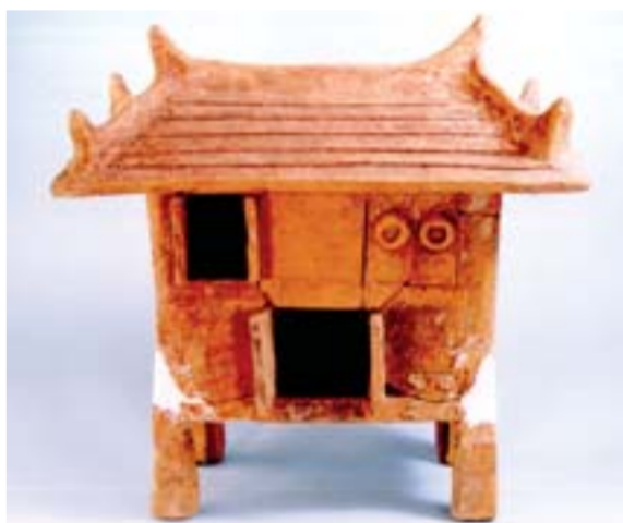
△长清大街出土的陶仓

大力推进南水北调水文化阵地建设，要在南水北调工程沿线重要的节点工程上建设一批品位档次高、功能设施全的