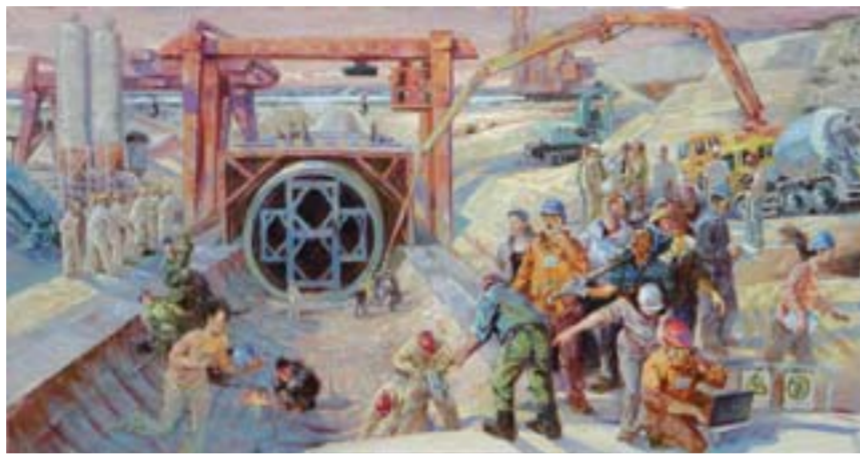
△南水北调·穿越黄河 作者：张焯、刘英宏、杜海涛、张忆菲 单位：曲阜师范大学

芦苇葱茏蒲香绿，荷花争娇银鱼喜。桃花水母展仙姿，白鹤野鸭享神趣。改善生态建湿地，提高水质创奇迹。四湖风光无限好，英雄壮举动天地。