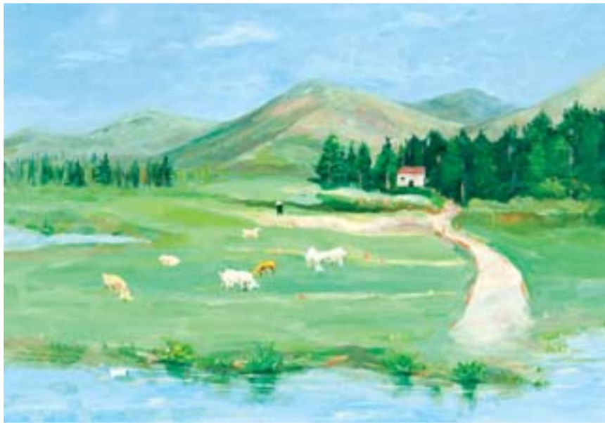
△东平湖畔 作者：马涛 单位：南水北调山东干线公司