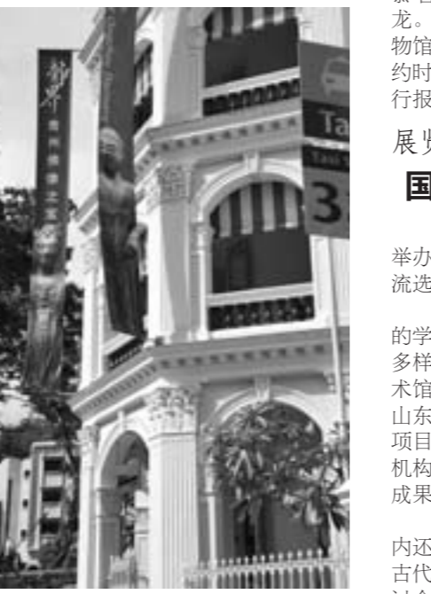
▲“青州佛造像展”在新加坡亚洲文明博物馆展出时的宣传条幅

近年来，山东省委、省政府确定了齐鲁文化“走出去”战略，对外文化交流与合作是这一战略的重要组成部分。在国家文物局的大力支持和引导下，省文物局以加强机构建设、拓展外联渠道为重点，走出去、引进来，加强文物境外展览工作力度，科学策划文物外展主题，整合文物外展资源，围绕我省传统文化优势，适应文物藏品特点，打造了一批特色鲜明、展品精美、内涵丰富的文物外展精品。“青州龙兴寺出土佛教造像展”、“孔子文化展”等展览先后在美国、德国、英国、日本、瑞士、西班牙、意大利、澳大利亚、新加坡等20多个国家展出，引起巨大轰动，成为国家对外交流的文化品牌。