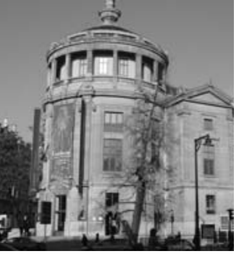
▲“孔子文化展”在法国巴黎展出

今年5月，第二届尼山世界文明论坛期间，举办了驻华使节走进山东文化遗产系列活动，来自五大文明古国的驻华使节、代表和专家们应邀出席了“文明古国文化遗产保护与促进文明对话国际研讨会”，共同探讨古文明国家文化遗产保护的机制，并实地参观考察曲阜“三孔”、邹城孟府和孟庙、泰安岱庙和泰山等文化遗产地。活动有效地宣传了我省文化遗产保护事业，进一步提升了齐鲁文化的国际影响力和世界知名度。巴西驻华大使胡格内在接受山东电视台采访时说，巴西和中国都有着丰富的世界遗产，相信两国未来在文化遗产保护方面将会有更多的合作机会。埃及驻华使馆文化参赞返京后特意以使馆名义照会山东省文物局，表示愿为促进埃及和中国两个文明古国之间和双方地方之间的文化交流与合作而努力。