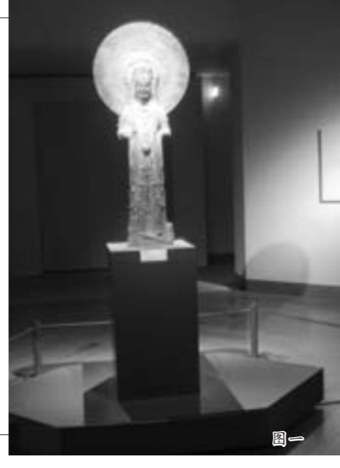
蝉冠菩萨像在日本美秀博物馆展出(图一) “青州佛造像展”在新加坡亚洲文明博物馆展出(图二)

◆长期以来，对外文物交流一直是中外文化交流中最有影响、最受欢迎、最具特色、最有实效的活动，不仅向世界人民介绍了博大精深、源远流长的中国古代文化，也展现了改革开放给中国带来的深刻变化。中国通过文物展览所表现的悠久文明和现代活力，对于世界有着巨大而永恒的魅力。