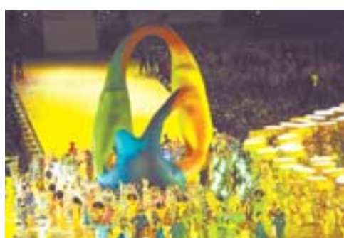
▲“里约八分钟”演出。