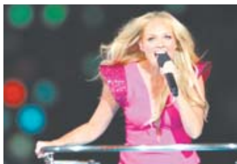
▲辣妹乐队成员在演出。