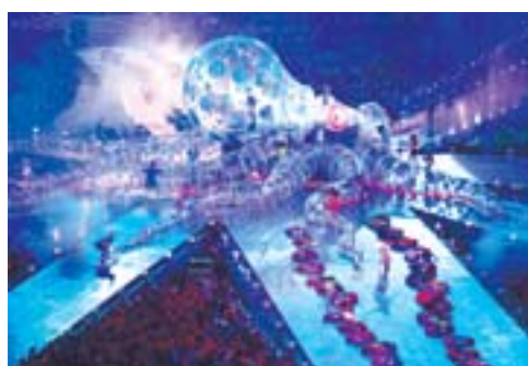
▲一只巨型章鱼模型出现在闭幕式现场。