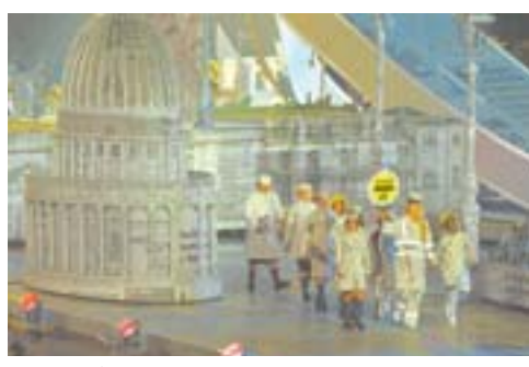
▲穿着“报纸外衣”的城市和人们。