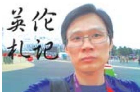
□ 本报特派记者 戴玉亮

的偶像组合威猛乐队两成员中的一位，《去年圣诞》、《无心快语》传唱至今，依然动听。后来乔治·迈克尔开始单飞，并长时间在美国居住。成单于后，乔治·迈克尔的音乐才华显得更加突出，8张冠军大碟，全球唱片卖出超过1亿张。这是一个多么可怕的数据。