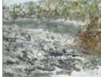
玉米地系列 布面油彩 60cm×50cm

刘明亮，1972年生，山东新泰人。2002年毕业于山东艺术学院，获美术学(油画)硕士学位。2010年毕业于中国艺术研究院，获艺术人类学博士学位。中国艺术人类学会理事，山东省美术家协会会员，齐鲁师范学院美术学院副院长、副教授，硕士研究生导师。