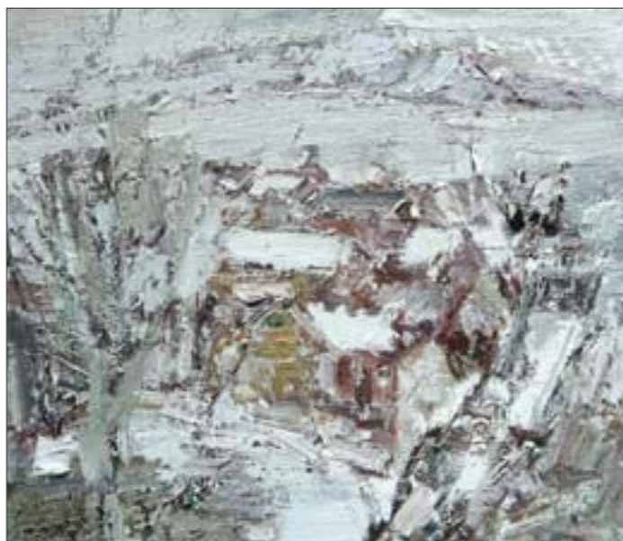
山村系列·白色世界 布面油彩 60cm×50cm