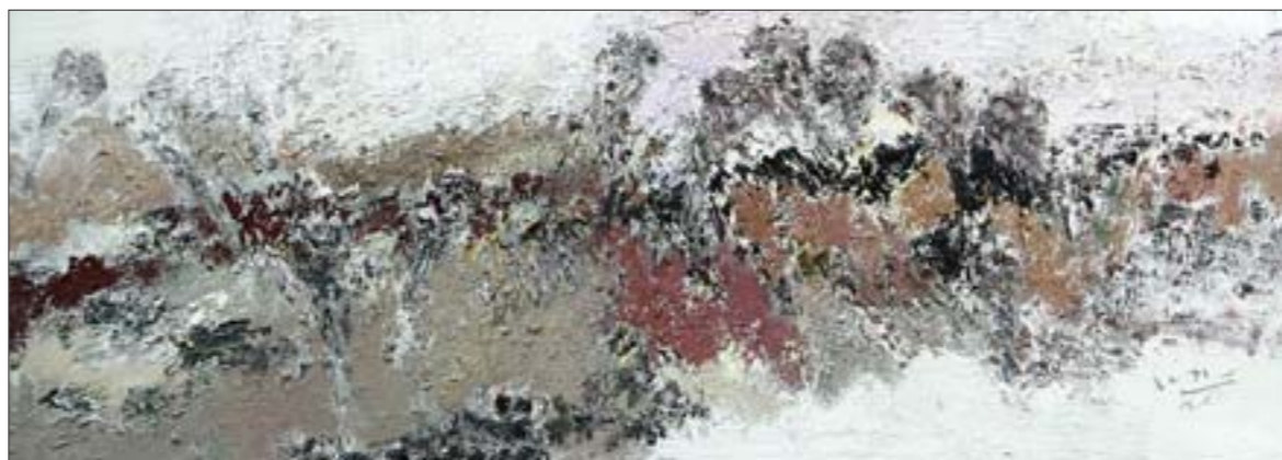
荷塘系列·韵 布面油彩 120cm×40cm

然而追根溯源，明亮自然的精神，是求真的态度和方法。他不用固定的眼光看待绘画，不破不立，正如明亮自己说，画山水心中要没有山水。