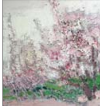
桃花系列 布面油彩 100cm×100cm