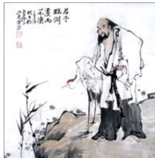
作者：山东省莘县观城镇育才中学 赵红光