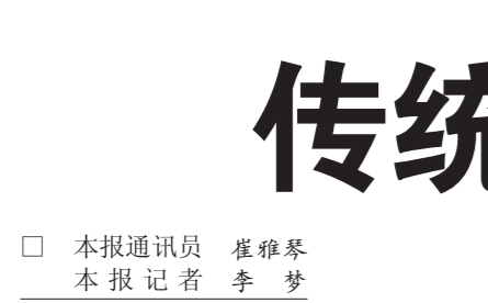
□ 本报通讯员 崔雅琴 本报记者 李 梦

关于证券公司、基金管理公司、期货经纪公司的机构监管费收费标准，在通知中规定，对证券公司和基金管理公司每年仍按注册资本金0.5%收取，最高收费额30万元；对期货经纪公司每年仍按注册资本金0.5%收取，最高收费额5万元。