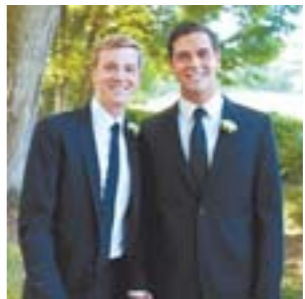
Facebook联合创始人休斯与同性男友完婚

瑞士一家机构3日表示，在已故巴勒斯坦领导人阿拉法特的衣服、牙刷和毛巾中发现了高放射性元素钚。阿拉法特于2004年去世时，很多巴勒斯坦人一直怀疑阿拉法特被人下毒。