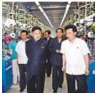
金正恩允许朝鲜妇女穿短裤厚底鞋

朝鲜领导人金正恩正在塑造国家新形象，允许妇女穿短裤、厚底鞋、戴耳环，让人们更方便地使用手机，食用以前被禁止的食品如比萨、薯条和汉堡。