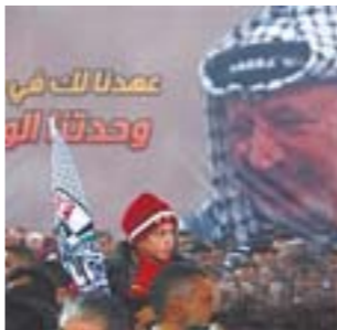
阿拉法特遗物被指检出高放射性元素钚

7月3日法国警方当天搜查了前总统尼古拉-萨科齐的住所和办公室，搜查与2007年总统大选中的贝当古政治献金案有关。