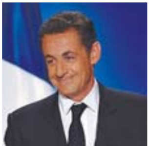
法国前总统萨科齐涉献金丑闻住所遭搜查

朝鲜领导人金正恩正在塑造国家新形象，允许妇女穿短裤、厚底鞋、戴耳环，让人们更方便地使用手机，食用以前被禁止的食品如比萨、薯条和汉堡。