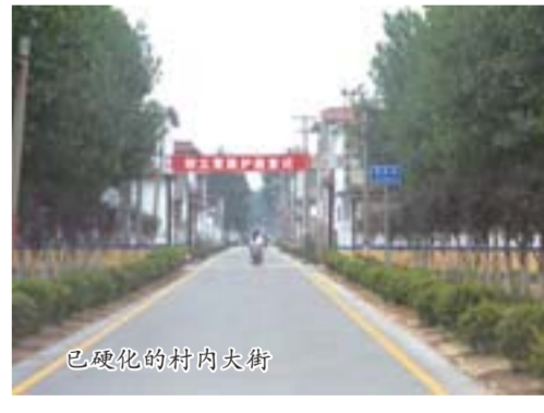
已硬化的村内大街