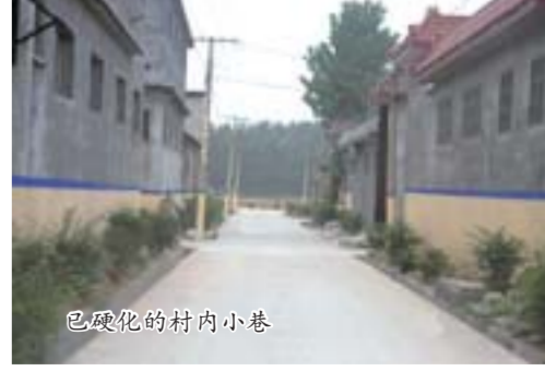
已硬化的村内小巷