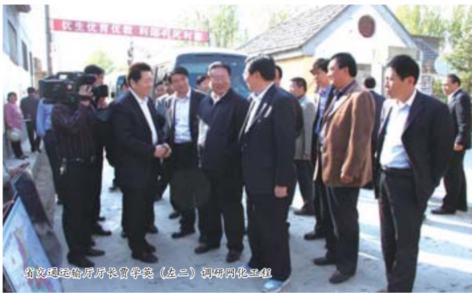
省交通运输厅厅长贾学军(左二)调研网化工程

据该市市长杨凤东介绍：“2012年，我们将继续执行2011年全市农村公路建设补助政策的基础上，增加村内街巷建设补助，仅此一项，市财政就增加农村公路建设补助资金3000万元以上，预计全年用于农村公路建设养护的市财政配套资金将达1.47亿元，投入之大为历年之最。”同时，各行行政村(居)“第一书记”，充分发挥领导作用，利用部门优势，给予各村资金、技术支持；积极发动群众，利用一事一议、社会捐助等模式破解资金难题，保证农村公路建设顺利进行。