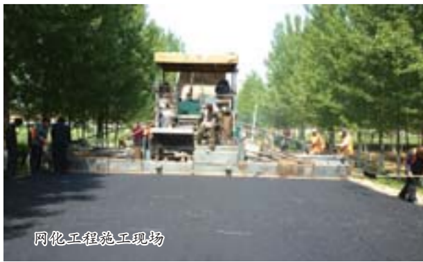
网化工程施工现场