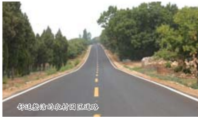
修建整洁的农村园区道路