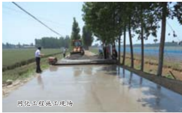
网化工程施工现场