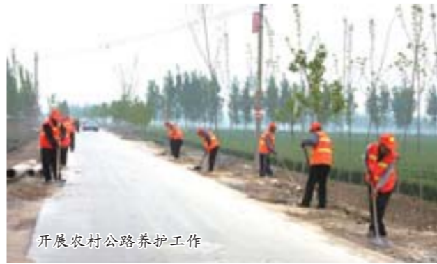
开展农村公路养护工作