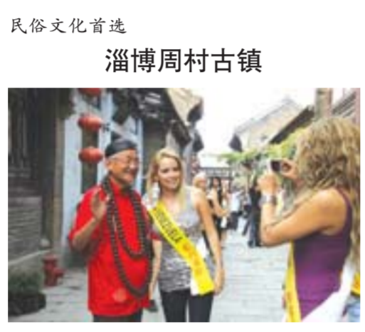
周村景区鸣锣开市、坐花轿、坐黄包车等丰富多彩的民俗活动吸引国内外的游客竞相拍照留念。

淄博周村，自清光绪年间，时任直隶总督袁世凯奏请皇帝自行开埠后，一时“天下之货聚焉”。最兴盛时，各种商号、作坊多达5000余家，是当时著名的“旱码头”、名符其实的“天下第一村”。对于自驾游来说，历史悠久、文化深厚、交通便利的周村，可以说是首选目的地。周村是中外合璧各种文化形态的缩影。这里保存有系统的中国商业传统模式，保留完好的各种时代风格的古商业建筑、完整的至今仍在发挥商贸作用的古代商业街市。游客还可以品尝到以“酥、香、薄、脆”四大特点扬名海内外的周村烧饼、工艺复杂的丁家煮锅、既美味又富营养的五香蚕蛹。