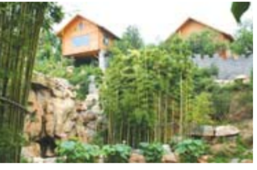
独栋、独院，设备齐全的小木屋带给游客与自然亲密接触的奢侈感受。

看过《北京爱情故事》的人都会对吴迪和武媚常去的汽车影院印象深刻，然而笔者也是最近才听说济南周边也有汽车影院。位于山清水秀的济南“后花园”——仲宫镇的乐沃自驾游营地为游客准备了您能想象到的所有自驾、露营体验。这里不仅有一月内新影片放映的汽车影院，游客们还可以体验攀岩、速降、真人CS等刺激的户外运动，其中，露营装备、自驾游用品的销售与出租、乒乓球、羽毛球、自行车俱乐部、餐饮住宿等也是应有尽有。济南乐沃是致力于打造集游、购、娱、宿、餐为一体的自驾游营地。在微凉的山风陪伴下，约三五知己，自己动手烤着全羊，看着超大屏幕的汽车电影，晚上在山间别有风味的小木屋里小憩，定会让您得到从未有过的满足。