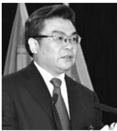
中共嘉祥县委书记 秦福华

今后五年,嘉祥将对接济宁主城区、融入鲁南经济带,大力实施工业强县、生态建县、科教兴县战略,着力增强产业实力,建设生态文明,统筹城乡发展,提高民生水平。