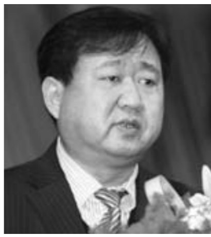
中共金乡县委书记 刘章群

今后五年紧扣创新赶超“一个主题”,围绕经济提速和民生改善“两条主线”,实施新型工业化、新型城镇化、农业现代化“三大战略”,强化干部队伍,发展环境、招商引资、要素供给“四项保障”,突破工业园区、新老城区、商贸物流区、羊山旅游度假区、生态湿地景区,现代农