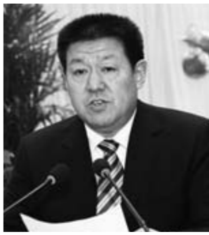
中共邹城市委书记 张胜明

今后五年以加速转型跨越为主题,坚持“经济强市、文化名城、生态靓市、和谐新市”的目标定位,更加注重民生优先,更加注重文化提升,更加注重生态文明,努力建设产业发达、城乡秀美、文化繁荣、民生殷实的和谐幸福新邹城。