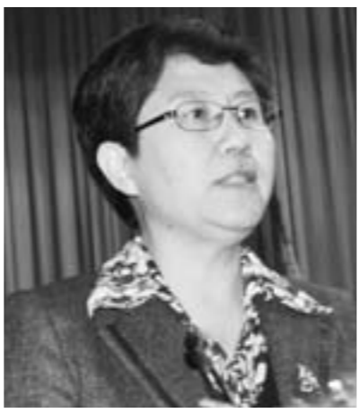
中共鱼台县委书记 李志红

今后五年以实现鱼台经济综合实力、城乡开发建设“两大突破”和构建和谐鱼台为根本任务,全力抓好膨胀工业经济、发展现代农业、培育新兴服务业、城镇建设管理、保障改善民生和党建工作创新“六项重点工作”,在新起点上开创经济社会发展新局面,实现鱼台的加速崛起全面振兴。