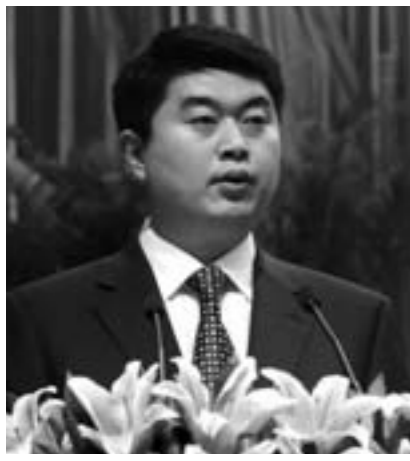
中共济宁市市中区委书记 张辉

今后五年,市中区将力争实现地区生产总值、地方财政一般预算收入、固定资产投资和城镇居民人均可支配收入、农民人均纯收入“五个倍增”。经济发展速度实现“一个高于”,即高于全市平均水平;服务业发展水平、城市管理服务水