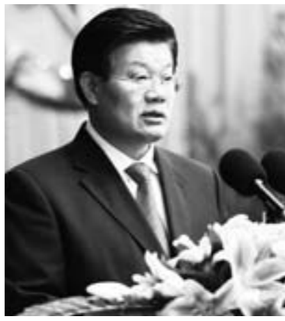
中共兖州市委书记 张玉华

今后五年围绕“转方式、调结构、惠民生”工作主线,突出“稳中求进、好中求快”发展基调,大力实施“产业转型升级、城乡一体发展、文化事业繁荣、社会管理创新、生态文明提升”五大战略,加快推进“工业强市、文化名城、商贸重镇”建