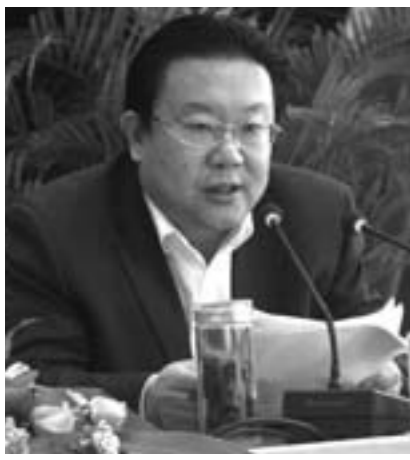
中共曲阜市委书记 李长胜

今后五年围绕“著名东方圣城、世界旅游名城、现代科技新城、生态宜居水城”发展定位,以“2711”工程为载体,大力实施工业立市、文化强市、商旅活市“三大战略”,努力构建经济富强、文化繁荣、城乡优美、民生殷实、和谐幸福的新曲阜。