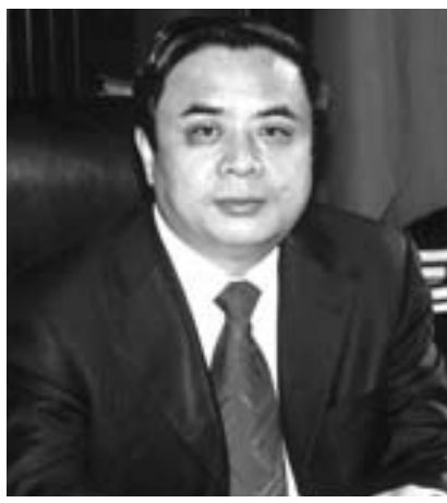
中共微山县委书记 程大志

今后五年以建设经济强县旅游名县滨湖新城为目标,突出产业转型、城乡建设、旅游开发、生态保护、民生民生、党的建设“六项重点”,努力实现经济社会大发展、大变化、大繁荣,在周边加速崛起,在全省争先晋位,努力把微山打造成为鲁苏鲁豫两省交界地区的璀璨明珠。