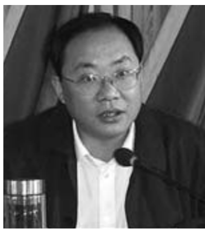
中共梁山县委书记 田卫东

今后五年围绕建设“工业强县、文化名城、生态和谐家园”的发展定位,着力打造全国具有实力和影响力的专用汽车产业基地、文化旅游产业基地、食品加工示范基地、商贸物流基地、特色农产品基地,全面开创富民强县、跨越崛起新局面。