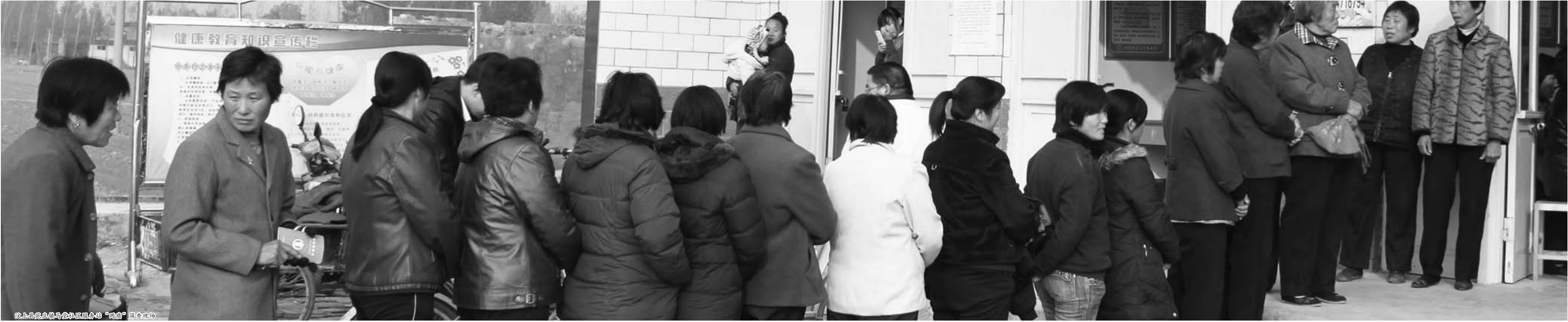
汶上县便民服务中心便民服务“两癌”筛查现场