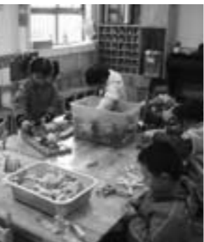
市中区实验幼儿园分园的孩子在新教室上活动课

济宁市教育局督学岳远方介绍，根据市委制定的学前教育三年行动计划，到2012年，济宁市将新建、改扩建公办和公办性质幼儿园260所，其中新建111所，改扩建15所，全市各类幼儿园新增公办教师达到2000名以上，在园儿童总数达22万名以上，学前三年入园率78%以上。