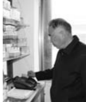
市中区一村民在村卫生室POS机上刷卡取养老金

记者了解到，今年济宁市新型农村社会养老保险制度保障工作计划扩大到一个县(市、区)，国家和省级试点县超额人员参保覆盖率已达到80%以上，市级试点县达到90%以上。7月份济宁已提前完成了全市新农保的全覆盖。