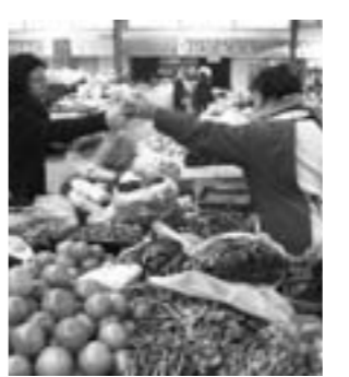
一位顾客在新华农贸市场内挑选蔬菜

2011年，城区计划改扩建农贸市场3处1.48万平方米。截至目前，新华农贸市场二期、后刘和土城3处农贸市场改建任务已全部完成，总投资共计3.5亿元，实际改建面积1.91万平方米。其中，新华农贸市场二期已经顺利通过城区农贸市场改造和建设小组验收，超额完成了年初确定的目标。