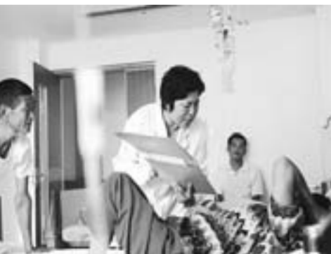
进行病人满意度调查