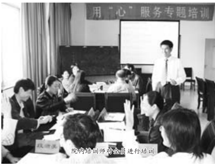
院内培训师对全员进行培训