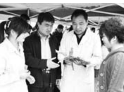
中医药专家普及中药材知识