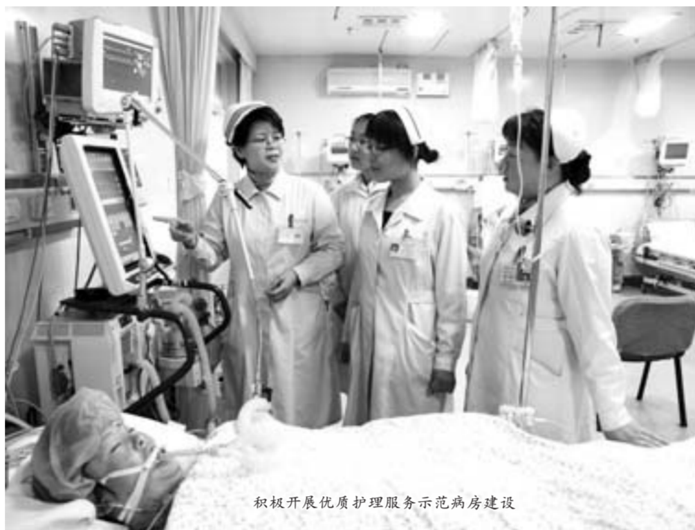
积极开展优质护理服务示范病房建设

大型医院的良性运转不仅事关医院本身的兴衰,更关乎当地老百姓的切身利益。借助新一轮国家医改大潮,临沂市人民医院不等不靠,主动出击,牢牢把握人民医院为人民、办好医院为人民的宗旨,提高医护质量不松手,控制医疗费用不合理增长不懈怠,并主动承担社会责任,发挥优质医疗资源的辐射作用,带动基层同步发展,以有限的资源、合理的代价有效维护了人民群众的身心健康。