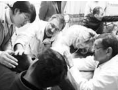
微笑行动外籍专家为唇腭裂患儿进行治疗