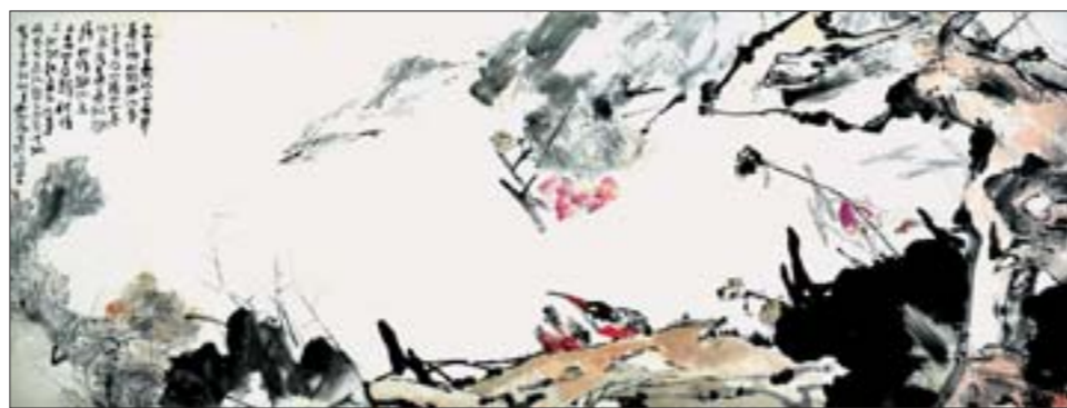
《形容出造化 想象成天地——荷花翠鸟》