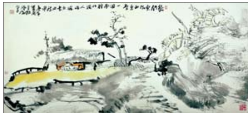
《几间东倒西歪屋——一个南腔北调人》