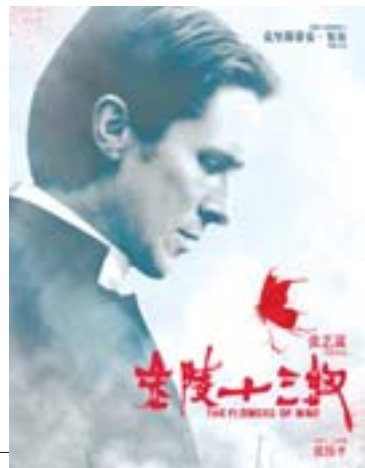
▲电影《金陵十三钗》海报。

综合新华社洛杉矶12月15日电 美国电影电视金球奖主办方好莱坞外国记者协会15日凌晨公布了第69届金球奖提名名单。法国黑白默片《艺术家》获得包括音乐片/喜剧类最佳影片在内的6大奖项提名，成为风头最健的问鼎者。中国导演张艺谋执导的《金陵十三钗》获得最佳外语片奖提名。