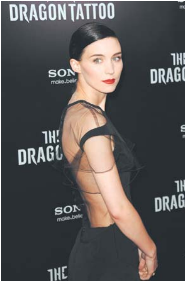
●影片《龙文身的女孩》纽约首映 北京时间12月15日，电影《龙文身的女孩》在美国纽约举行首映式，影片主演、美国女演员鲁妮·马拉(右图)抵达现场助阵。

在剧中，庞天德和娜塔莎曾隔着一条河遥遥相望，只能通过“旗语”来传达彼此之间的思念。朱亚文说：“在这个时候，爱情胜过了理想和主义给人的力量。”