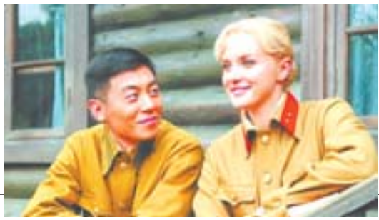
▲电视剧《我的娜塔莎》剧照。