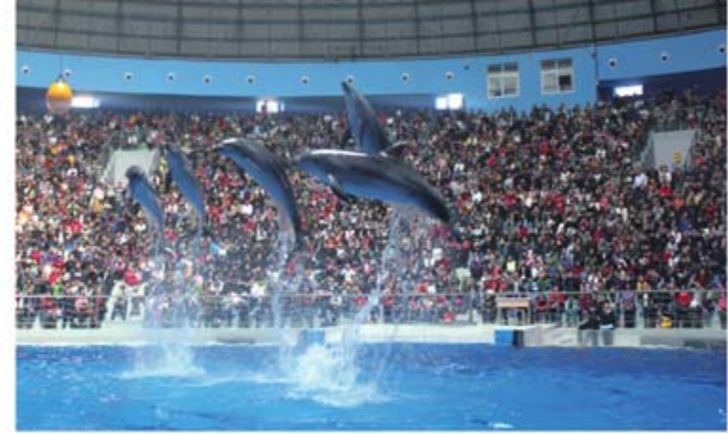
泉城海洋极地世界海豚表演

齐河县坚持高点定位,顶层设计,重点突破。将黄河国际生态城定位于“济鲁一体化先导区、省会城市群重要商务区、全省现代服务业集聚区”,请名家聘高手,建设“国家级旅游度假区和国家级生态经济示范区”。先后聘请省旅游规划设计研究院编制了旅游业发展总体规划,委托新加坡裕源国际编制了全县黄河国际生态城总体规划,聘请5名“两院”院士规划设计了“文化旅游大观园”,委托中国对外建设总公司城市规划设计院、北京杰地亚公司规划了东盟现代生态城,委托美国帕金斯伊士曼公司规划设计了晏子湖景区。项目规划设计累计投入近亿元,水平达到了国内领先、国际一流。在项目选择上,坚持符合国家产业政策、总体规划、群众需求、文化休闲新业态“四符合”标准,选择带动能力强、就业容量大、低能耗、无污染的大高名外项目。依据项目选择标准,黄河国际生态城建设重点突出了5大特色:突出生态特色,景区森林覆盖率超过60%,水面、湿地面积达到30%,所有项目