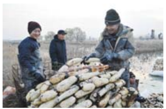
□唐岱霞 高桦 报道

潍坊高新区党委书记、管委会主任赵志远说: “发展的最终目的是为了惠及群众,我们要把发展成果最大限度地让群众分享,以民生为本,全面打造幸福高新区。”