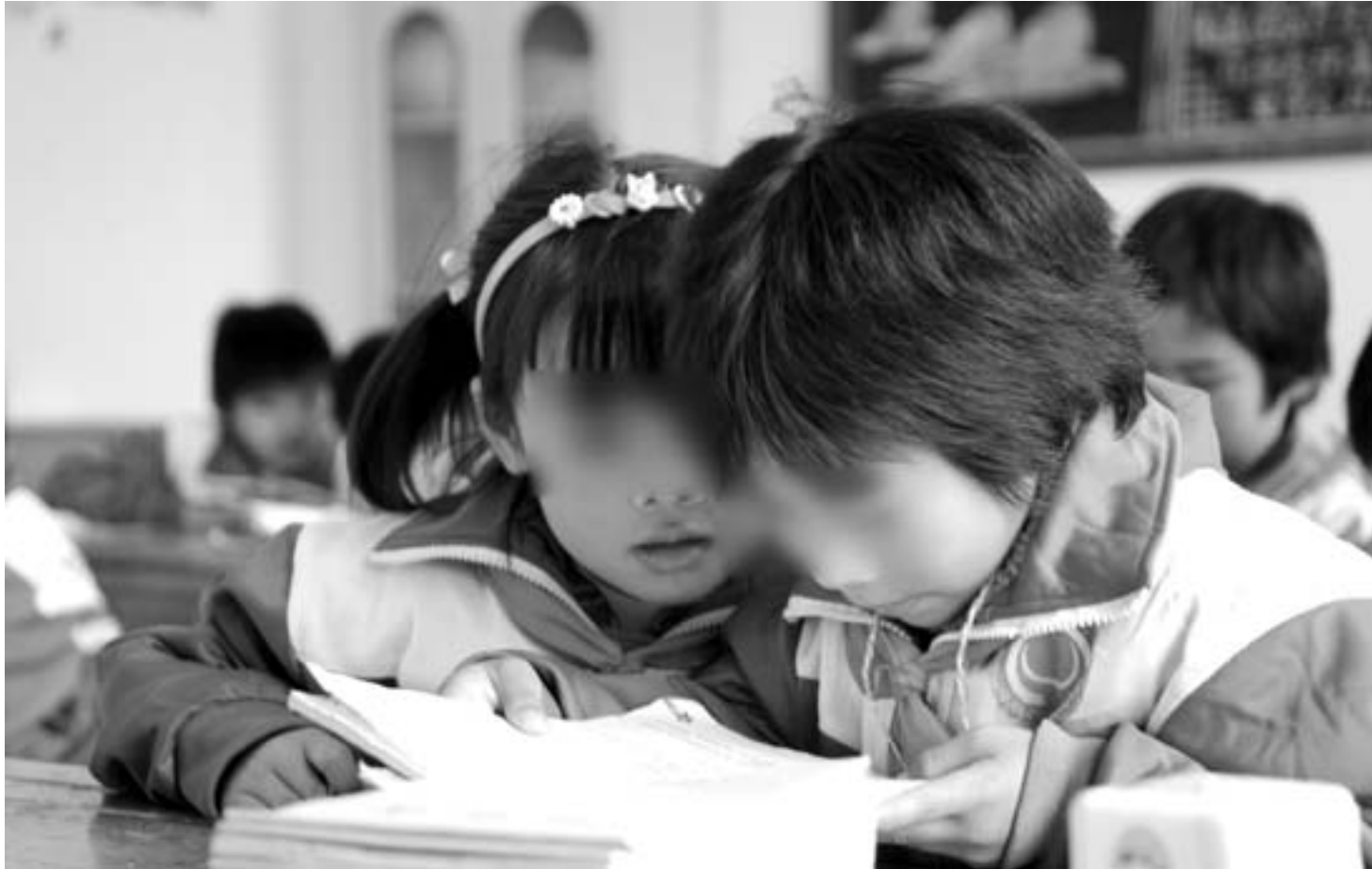
▲泗水九巨龙慈善学校的孩子们在温习功课。

会议要求,要构建事实无人抚养未成年人的长效机制,建立基本生活保障制度,成立专项关爱基金,各县市区固定两到三所寄宿制学校,专门接收事实无人抚养未成年人,逐步建立家庭、学校、社会“三位一体”的管理监护体系。