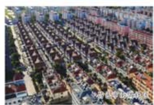
昌邑市柳疃镇社区