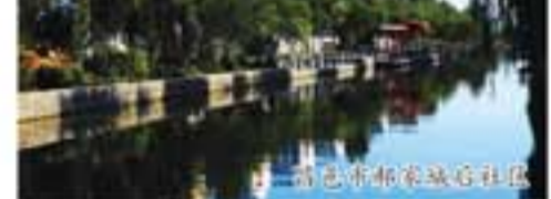
昌邑市柳疃镇社区