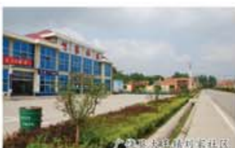
广饶县广饶镇社区