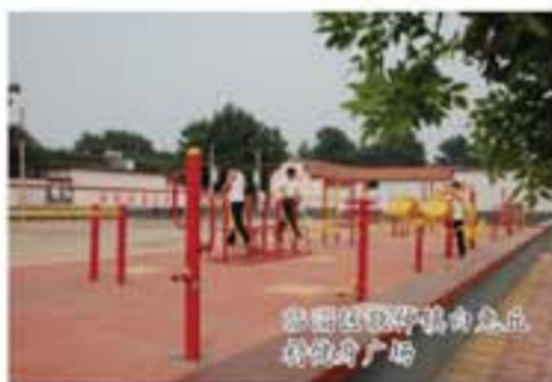
临淄区辛店镇辛店村

安排基础设施、公共服务设施以及周边环境建设,加快公共设施向农村覆盖、公共服务向农民延伸。二是强化监督考核。严格落实整治责任,按照属地管理和“谁管理、谁负责”的原则,对12个镇、街道和13个区直部门三类进行考核,并将其列入区委、区政府重点督查事项,纳入全区目标责任考核体系。区财政列出专项考核补助,根据考核成绩,按分值确定实际补助金额并汇总发放至各镇、街道(村居)。三是搞好长效管理。健全农村卫生长效保洁机制,按照“有人保洁管理、有垃圾收集运输设施、有资金投入渠道保障”的思路,实行区、镇、村三位一体的三级环卫管理,实现了“户集、村收、镇转运、区处理”的城乡垃圾处理一体化。