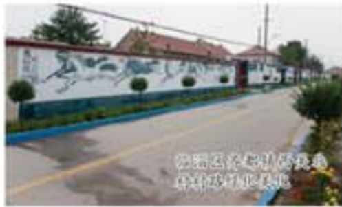
临淄区辛店镇辛店村

结合临淄实际,根据各村自然地貌及民俗风情,大投入、出重拳,突出解决村庄“脏、乱、差”问题。一是开展以垃圾治理为重点的环境卫生整治。加大财政支持力度,投资3000万元建设了日处理生活垃圾200吨的大型垃圾压缩站,对建设压缩式垃圾中转站的镇、街道按照每座20万元的标准进行补助,按照每千