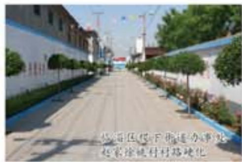
临淄区辛店镇辛店村

广饶县坚持集中治理与长效管理相结合,行政推动与全民参与相结合,在县、乡(镇)、村三级联动中完善工作机制,凝聚工作合力。在县级层面,成立了由县委、县政府主要领导任组长的环境整治领导小组,实行县级领导包乡镇责任制,建立了日常督查、定期观摩评比、年终考核“三位一体”的考核体系,将环境整治纳入全县综合考核,调动了全县各级抓环境整治的积极性和主动性。在乡镇和部门层面,积极推进城管执法重心下移,形成了责权利统一、运转高效、联动协作、齐抓共管的体制机制。在村级层面,把治理农村环境与制订村规民约结合起来,组织村民自觉参与农村环境整治,形成了“政府组织、乡镇实施、村民自治”的管理格局。