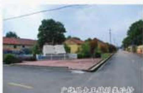
广饶县广饶镇社区

该县按照“点线结合、城乡统筹、系统推进”的思路,重点实施了三大专项行动。一是深入开展城乡环境综合整治。召开了县、乡(镇)、村三级领导班子参加的动员大会,制订了环境综合整治方案,以清“三堆”、治“四乱”为重点,对城乡环境进行了彻底整治,城乡环境得到全面改善。二是强力推进水气污染治理。连续两年开展了水气污染治理专项行动,严厉查处违法排污行为,近两年先后配套实施了总投资25亿元的42个环保治理项目,依法取缔农村“土小”污染企业198家,大气和流域水质显著改善。三是系统推进“三网”绿化工程。大力实施“三网”生态绿化工程,5年来县财政投入专项资金1.6亿元,带动社会投入4.9亿元,累计植树2000多万株,全县林木覆盖率达到29.8%。