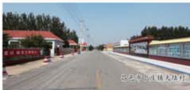
昌邑市下庄镇大陆村

近年来,昌邑市按照新农村建设“二十字”方针要求,以打造良好的农村生产生活环境为目标,坚持城乡统筹、一体发展,积极开展村容村貌整治,加强农村基础设施建设,促进了农村人居环境质量、农村基础设施水平和农村和谐文明程度“三个明显提升”,群众的幸福感和满意度不断提高。