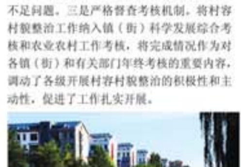
昌邑市柳疃镇社区