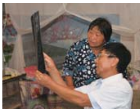
上门回访出院患者。