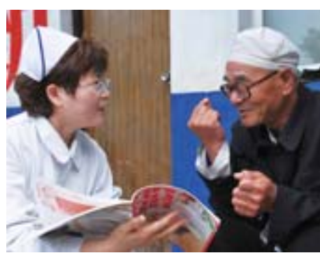
将健康指导送到群众家中。