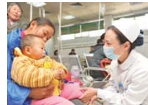
温情服务,拉近医患距离。