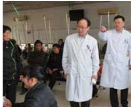
每周例行大查房,发现问题当场解决。