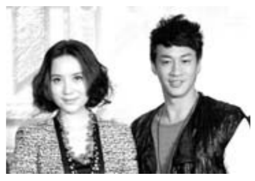
电影《遍地狼烟》12月2日全国公映 10月17日，电影《遍地狼烟》官网启动仪式在京举行，主演宋佳(左)和何润东(右)等出席记者会。