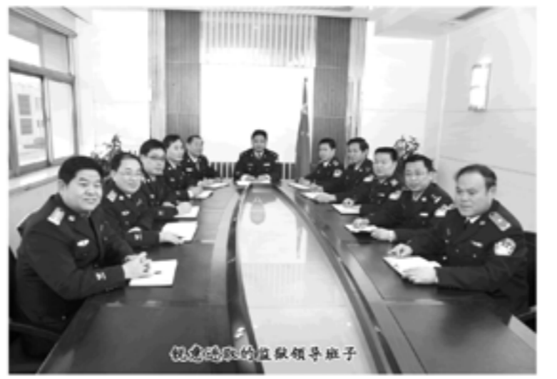
改造现场的监狱领导班子

鲁南监狱曾创造出一系列闻名全国的先进典型经验:他们创办了全国监狱系统第一份罪犯心理咨询报纸——《心理导航》;开设了全国监狱系统第一条心理咨询热线——“心桥热线”;建立了全国监狱系统第一个亲情教育短信交流平台;在全省监狱系统率先开展了“一区一品”监区文化建设活动……他们以中华传统美德教育改造服刑人员的成功做法还引起了中国社会科学院的高度重视,特派法学研究所专家专程到该狱进行国情调研,并将其载入了《中国法治报告蓝皮书》;以文化强警为主要内容的监狱警察队伍建设不断实现新突破,在造就一支政治坚定、业务精通、作风优良、执法公正监狱警察队伍的同时,也取得了与文明和谐监管相互促进、共同提高的巨大成效;先后被司法部命名为部级现代化文明监狱,被评为“全国司法行政系统先进集体”、“全国监狱系统文明执法先进单位”、“省级文明单位”、“山东省先进基层党组织”、“山东省文化建设成果一等奖”、“山东省文化建设十佳单位”等荣誉称号,并荣记集体一等功两次,集体二等功四次。